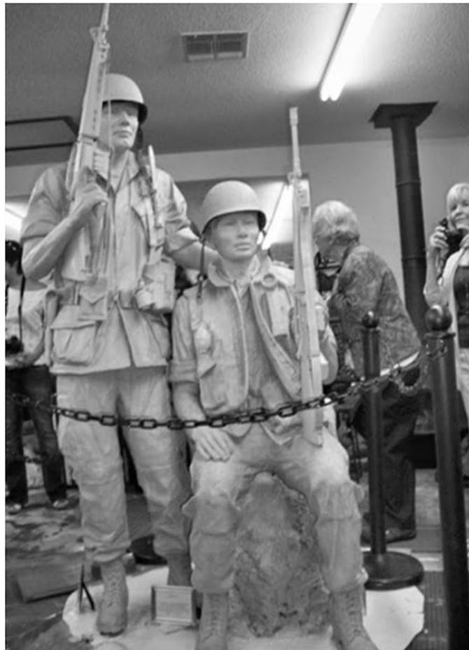
Đài chiến sĩ Việt Mỹ, Wichita, KS (mô hình bằng thạch cao)