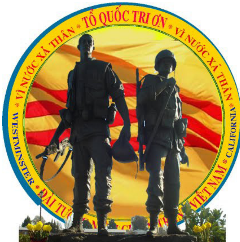
Tượng đài chiến sĩ Việt Mỹ, Wichita, K