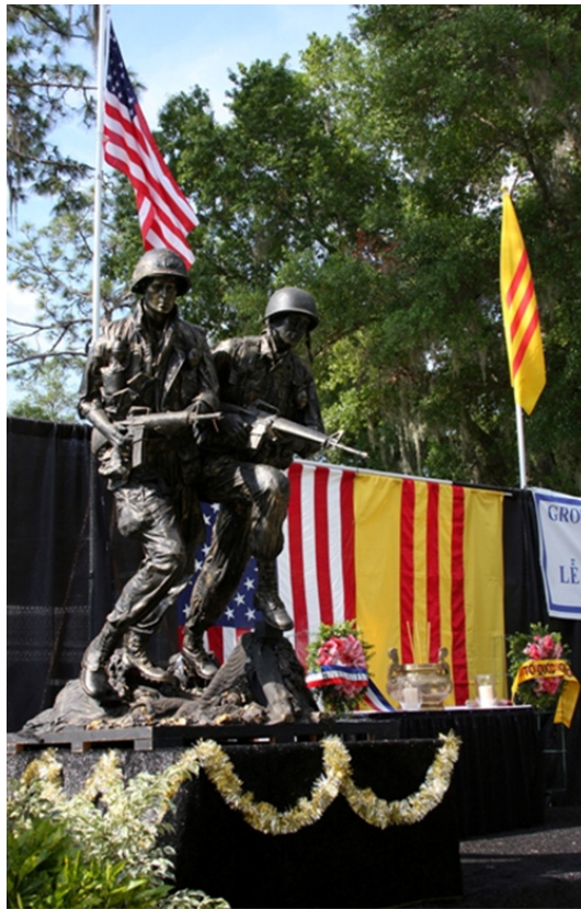
Tượng đài chiến sĩ Việt - Mỹ , Bellaire, Houston