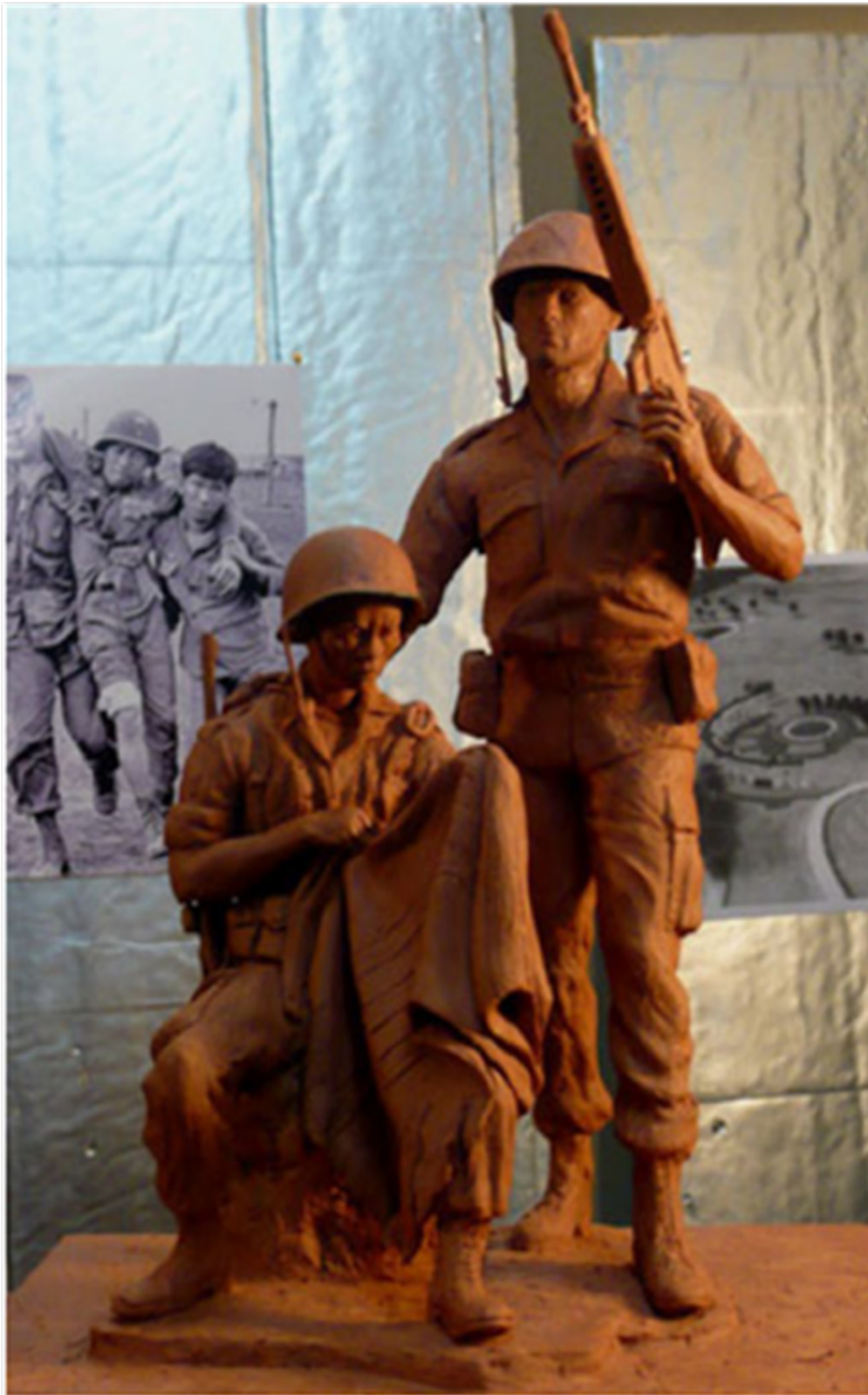
Tượng đài chiến sĩ Việt Mỹ, Arlington, TX (nhìn đằng trước)