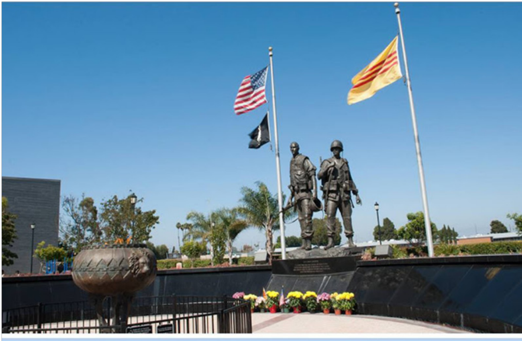
Tượng đài chiến sĩ Việt - Mỹ, Westminster, CA