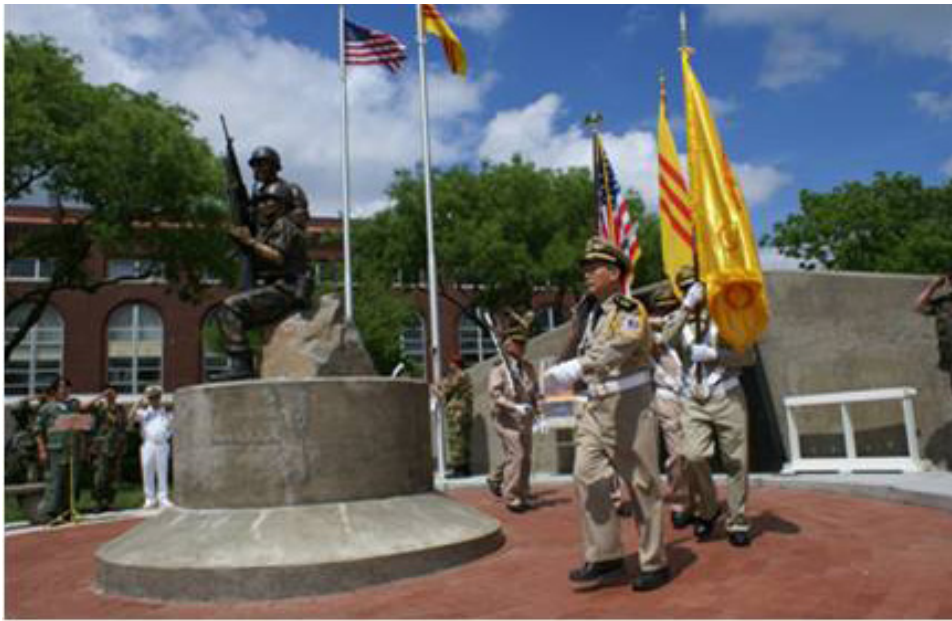
Đài chiến sĩ Việt - Mỹ, Wichita, KS