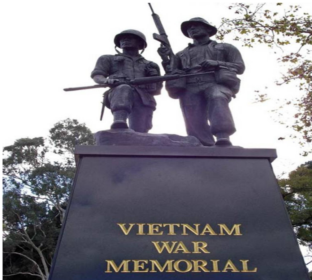
Tượng đài chiến sĩ Úc - Việt ,Victoria, Australia