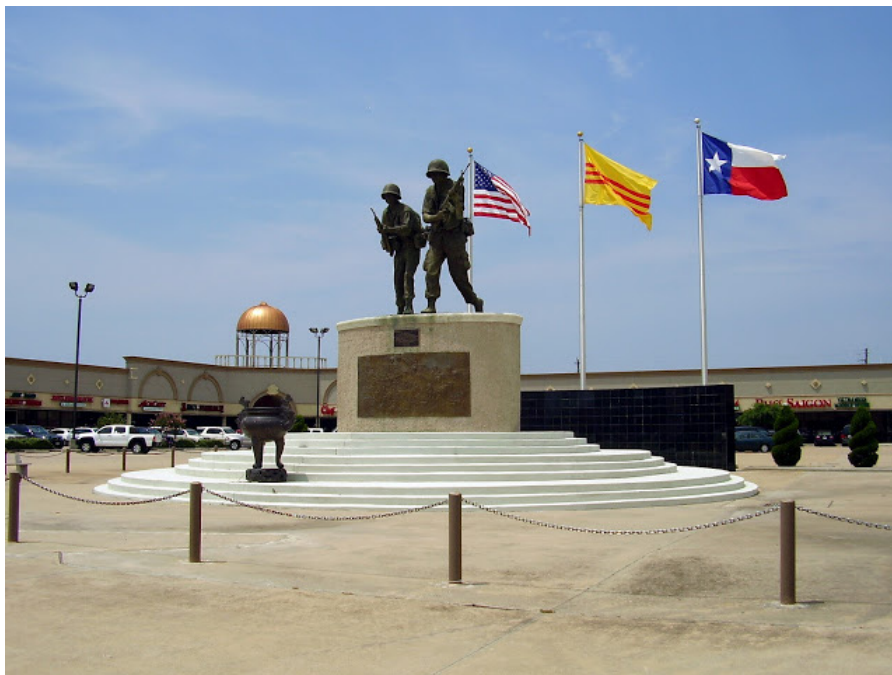
Quảng trường đài chiến sĩ Việt Mỹ, Bellaire, Houston, TX