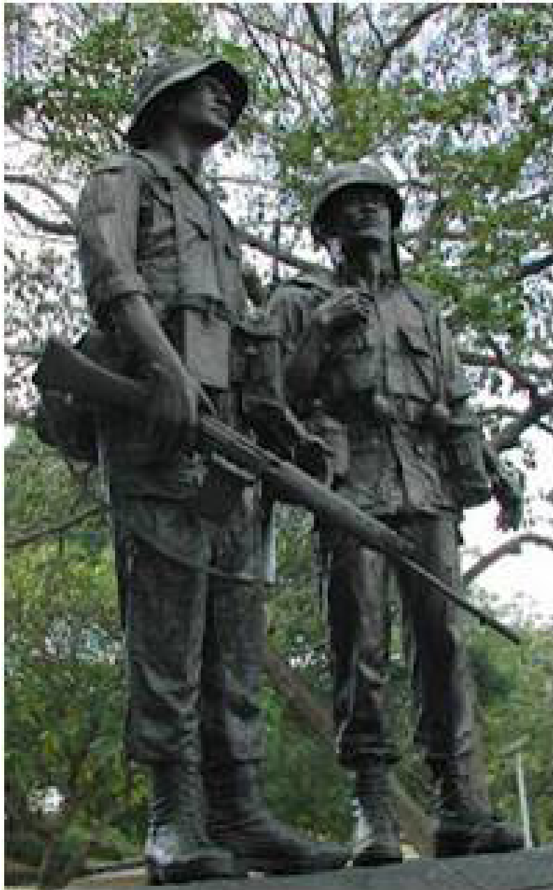
Tượng đài chiến sĩ Việt - Mỹ , Orlando, Florida