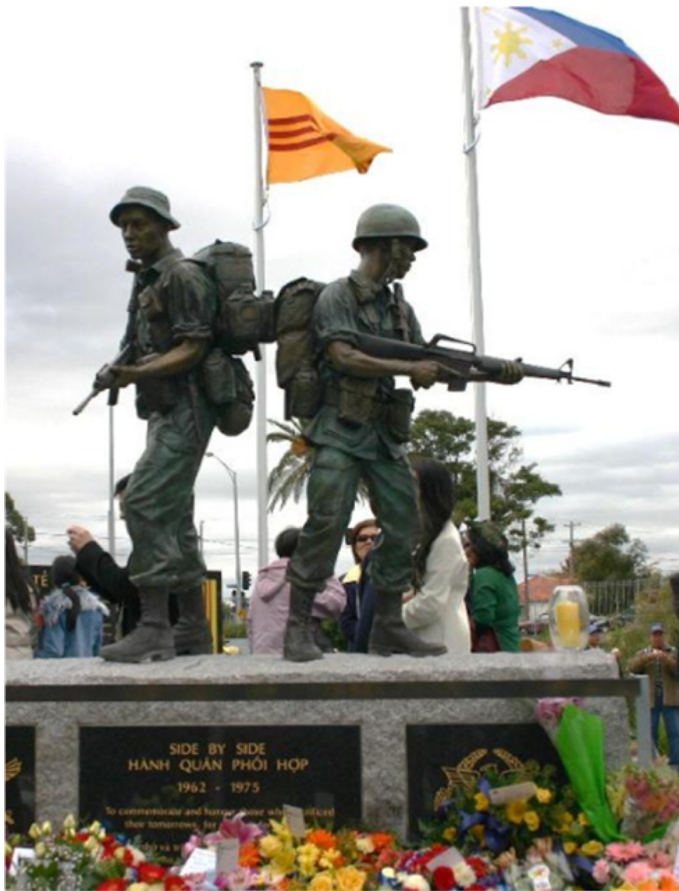
Đài chiến sĩ Nam Úc, Australia