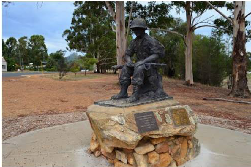
Tượng đài chiến sĩ Úc - Việt, Adelaide, Australia