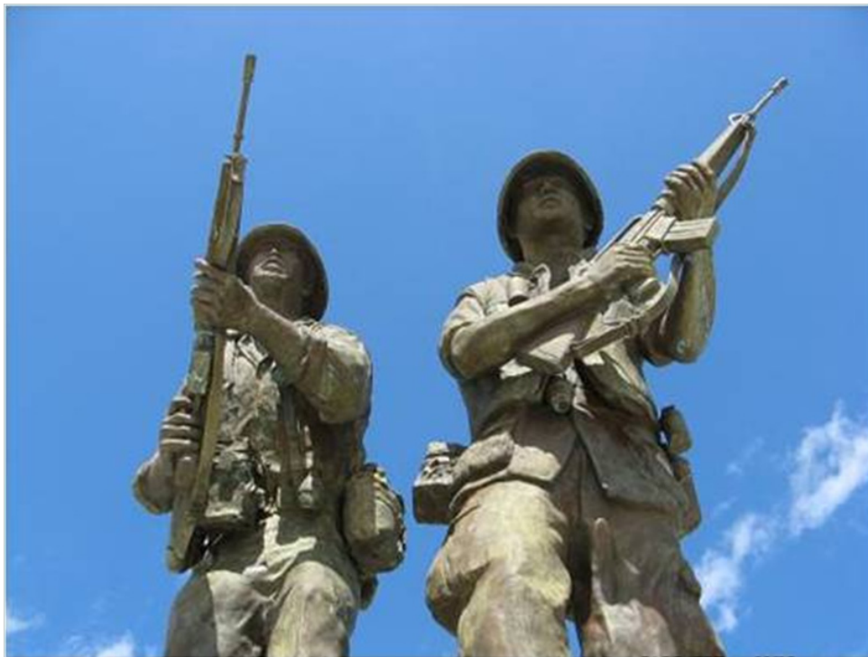
Tượng đài chiến sĩ Việt Mỹ, Houston, TX (nhìn đằng trước)