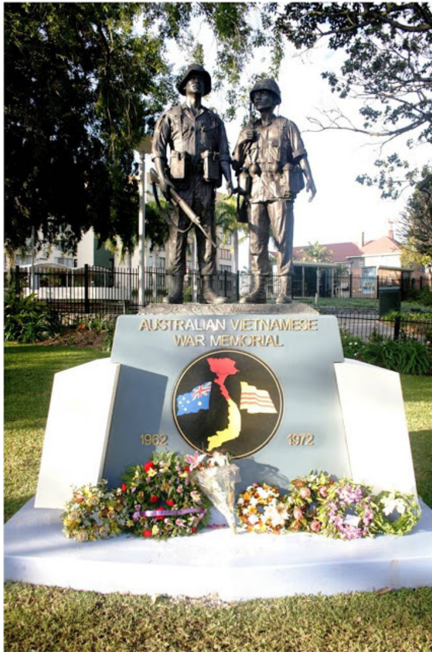
Tượng đài chiến sĩ Victoria, Australia