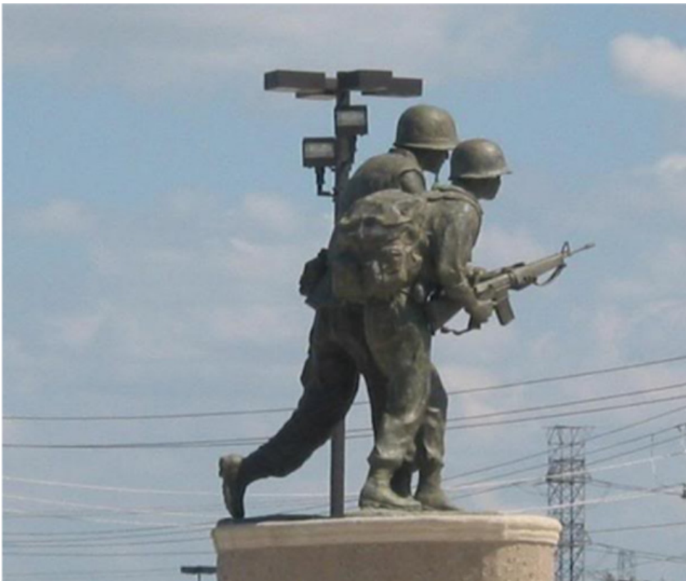
Tượng đài chiến sĩ Việt - Mỹ, Houston, TX (nhìn đằng sau)