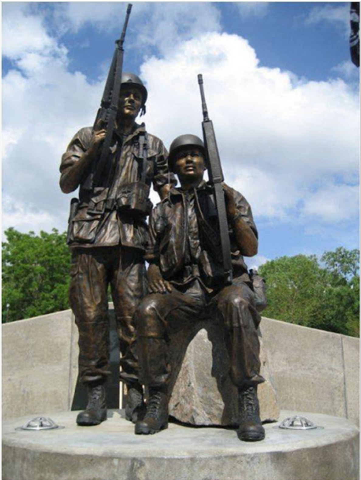
Tượng đài chiến sĩ Việt - Mỹ Wichita, KS (nhìn đằng trước)