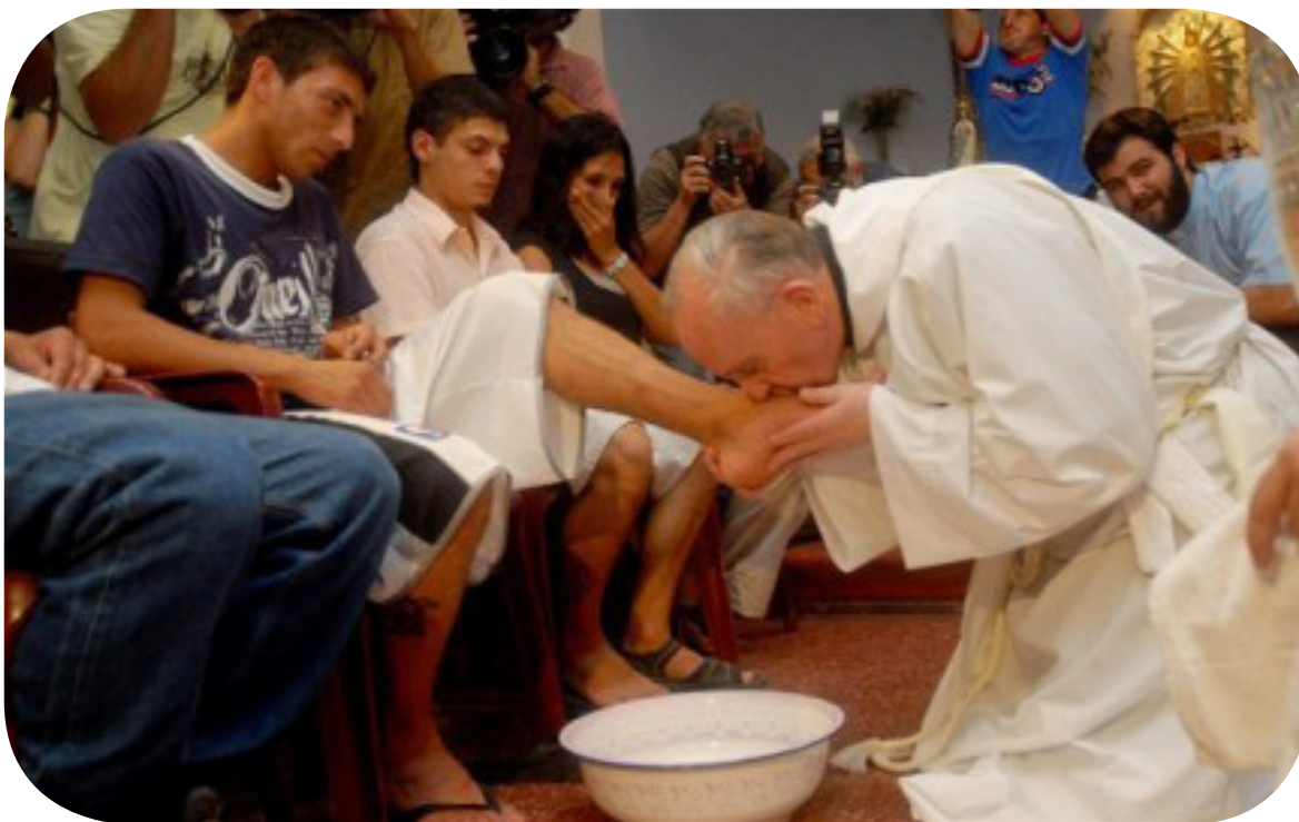
Ngài khiêm nhường quỳ xuống hôn chân giáo dân trong một nghi lễ.