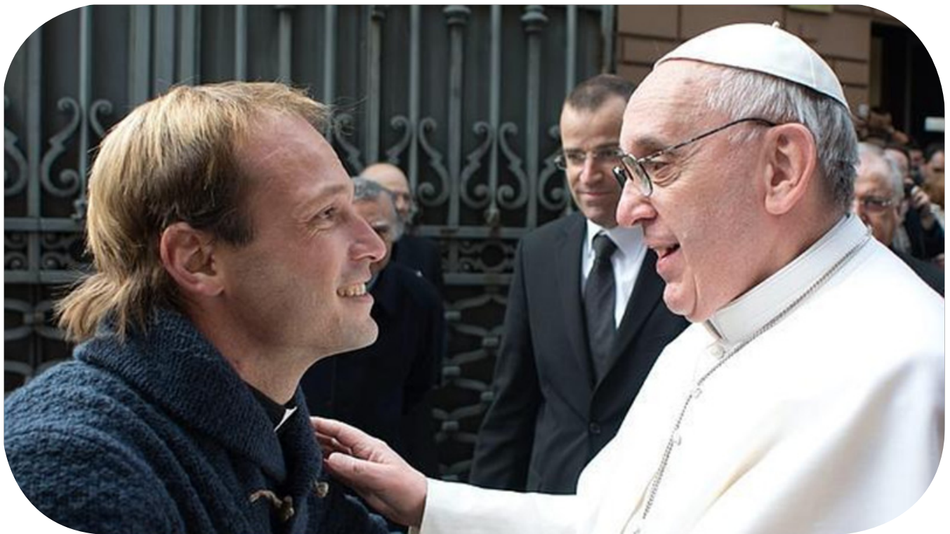
Ngài cũng luôn hết sức gần gũi với giới trẻ.