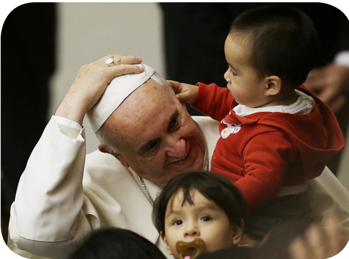
Ngài còn là người gần gũi với tất cả mọi người, và đặc biệt rất yêu thương trẻ em.