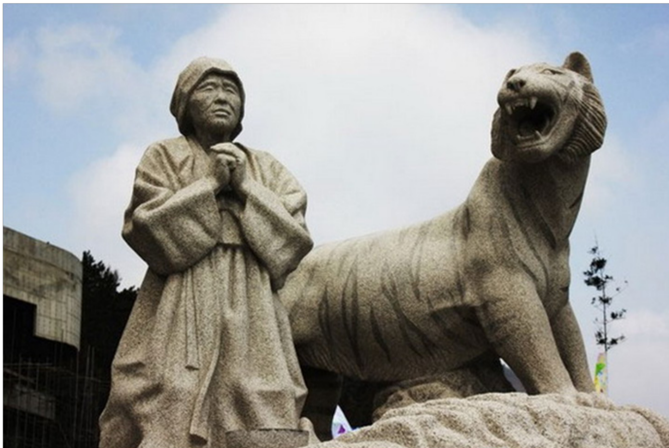
Hình ảnh bà lão Bbyong chấp tay cầu khẩn thần biển mong thoát khỏi kiếp nạn hổ dữ

Sáng hôm sau, bà Bbyong cùng người thân ra biển thì thấy nước biển chia làm đôi, lộ ra một con đường đất. Gia đình bà đi qua đâu, nước biển trở lại tới đó, ngăn không cho lũ hổ dữ vượt đại dương. Vậy là bà Bbyong thoát được kiếp nạn sinh tử.