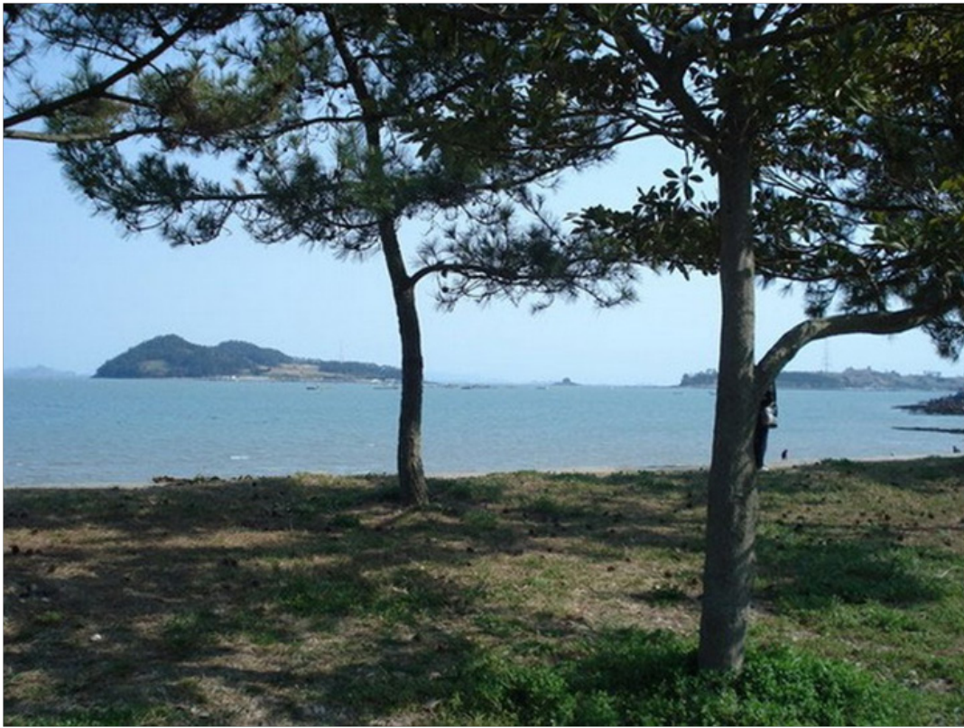
Thông thường, giữa đảo Jindo và Modo hoàn toàn không có bất cứ cầu nối nào