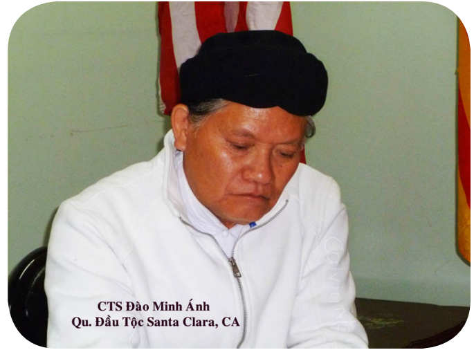
CTS Đào Minh Ánh Qu. Đầu Tộc Santa Clara, CA