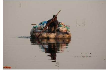
Yamuna river: The river ranks among the top 10 dirtiest rivers of the world, along with the Ganga. With Delhi dumping the most (58%) waste in Yamuna, and almost all efforts to clean it failing, the river is fast turning into a vast sewage.

Hoa Kỳ vào năm 1990, đã sản xuất 36% sản phẩm của toàn thế giới, do đó có trách nhiệm trên 36% lượng khí phóng thích vào bầu khí quyển tạo ra sự hâm nóng toàn cầu. Trong lúc đó Nga Sô chịu trách nhiệm 17,4%. Ấn Độ và Trung Cộng vì được xếp vào các quốc gia đang phát triển cho nên được miễn mức tiết giảm cho đến năm 2012.