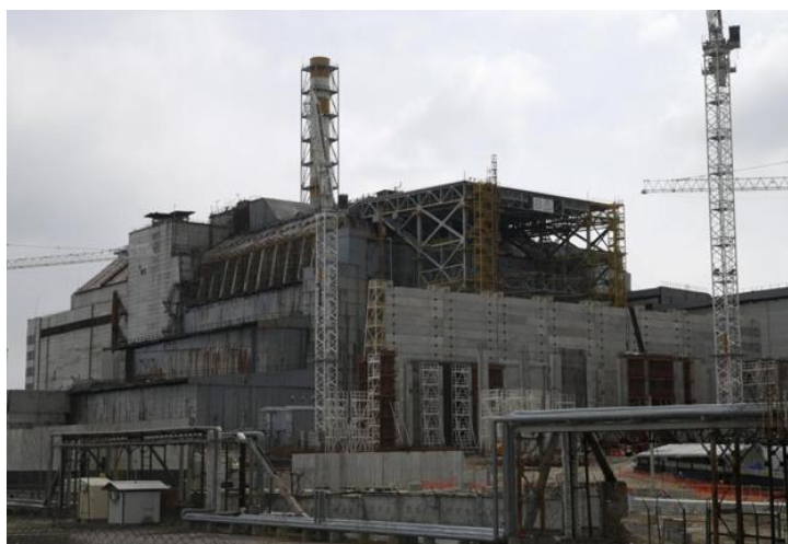
Chernobyl, Ukraine: The deadly nuclear melt-down in the Chernobyl power plant in 1986 released 100 times more radiation than the bombs dropped on Hiroshima and Nagasaki. The 19 mile exclusion zone around the site continues to be one of the most uninhabitable.

Những tệ trạng đã và đang xảy ra cho chúng ta như dự kiến trên đây, là do chính chúng ta là thủ phạm.