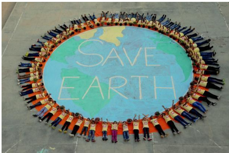
School children take part in an awareness programme on the eve of World Earth Day in Mirzapur, Uttar Pradesh on Tuesday.

Từ ngày thành lập, một hệ thống Mạng lưới Ngày Trái Đất (Earth Day Network) được thiết lập để cổ súy việc tham gia của tất cả người dân sống trên địa cầu, và có trách nhiệm hàng động trên toàn thế giới. Ngày này năm 1990 ghi nhận có 200 triệu người trên 141 quốc gia tham dự.