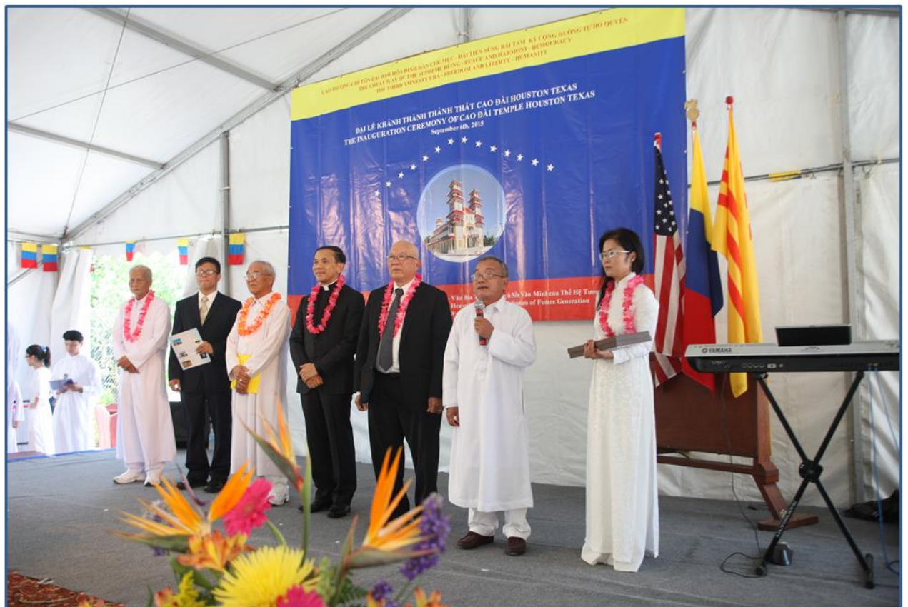
Đại diện các Tôn Giáo Việt Nam và Chức Sắc Cao Đài