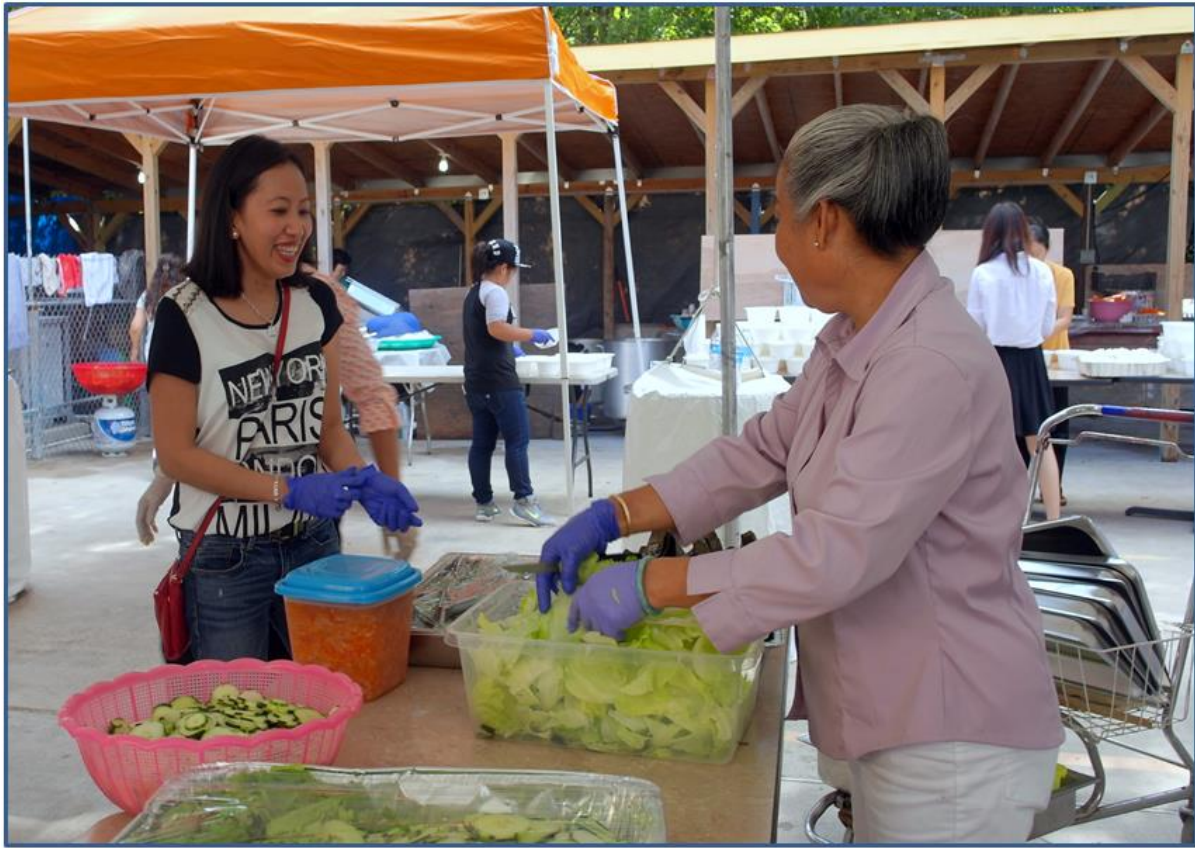
Những anh hùng 'nổi danh' trong nhà bếp