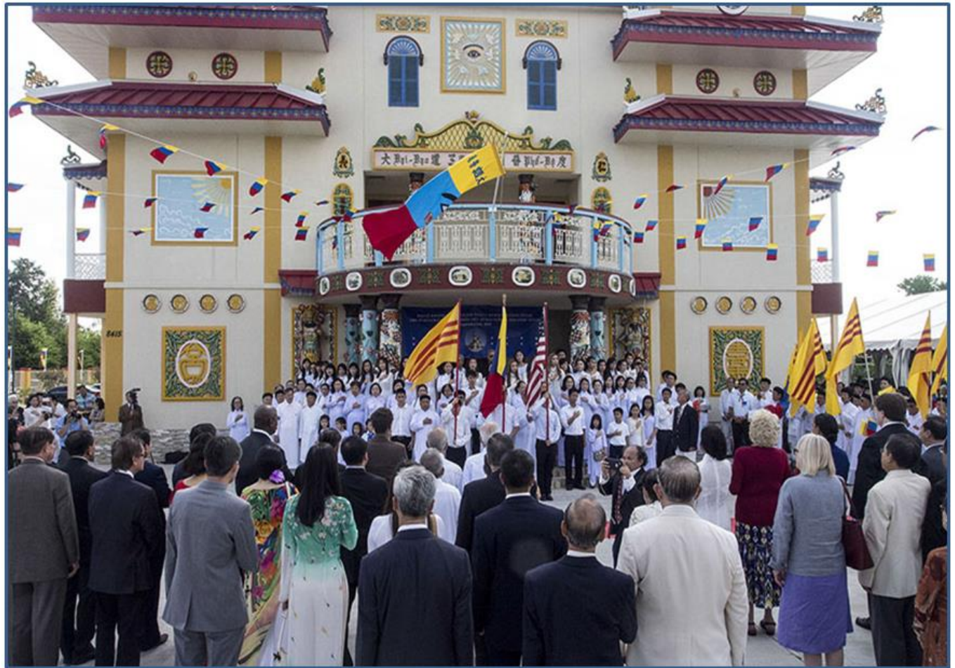
Chào Cờ Đại Lễ Khánh Thành Thánh Thất Cao Đài Houston Texas