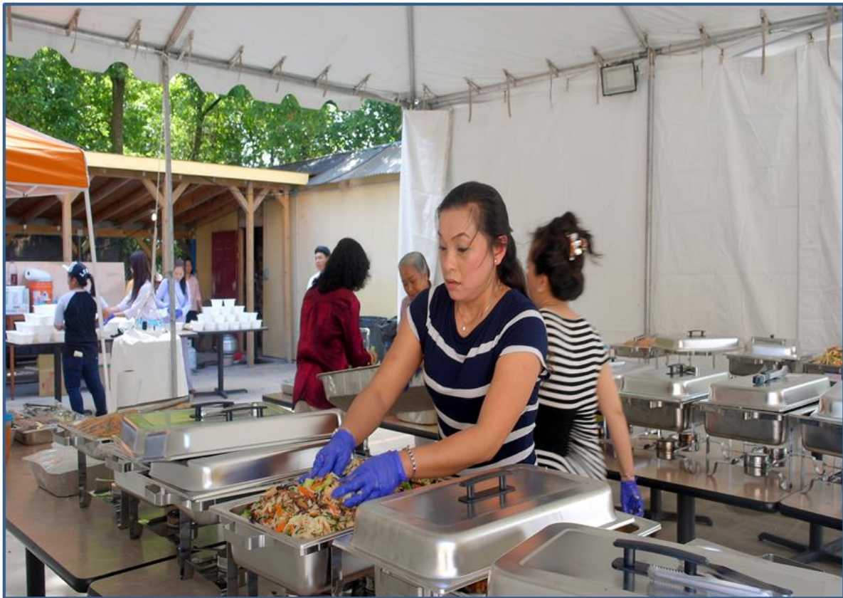
Những anh hùng 'nổi danh' trong nhà bếp