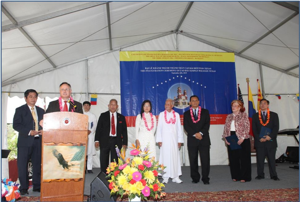
Các Nghị Viên Thành Phố Houston