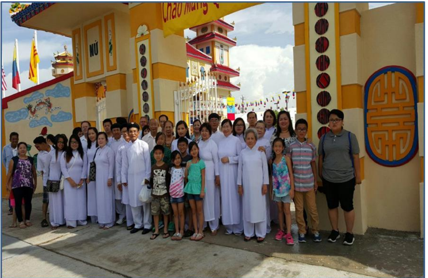
Phái đoàn Wichita