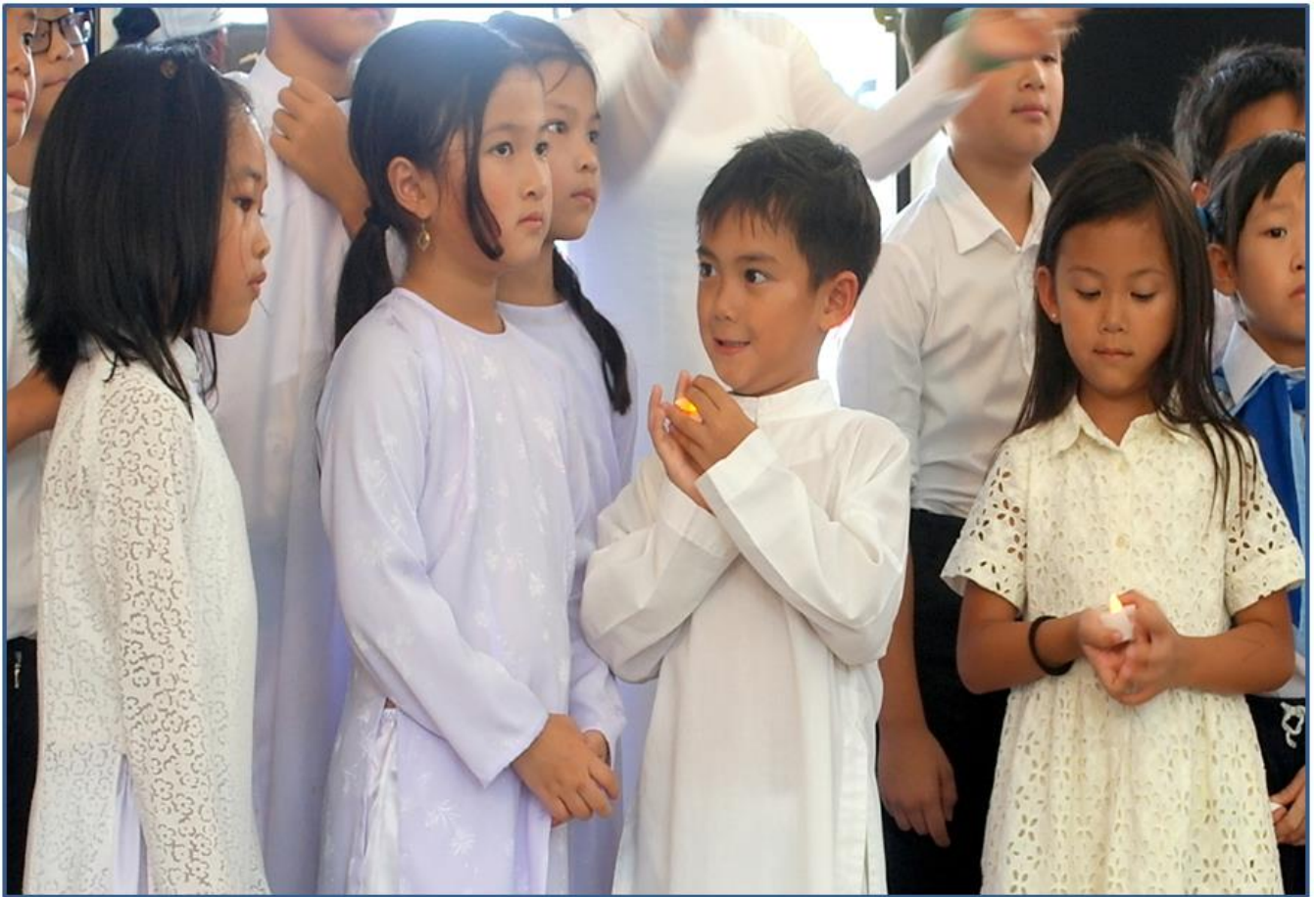
Những anh hùng tí hon giúp đón khách, giúp chào cờ, và chờ 2 hrs để tham gia giây phút cộng hưởng "We Are One!"