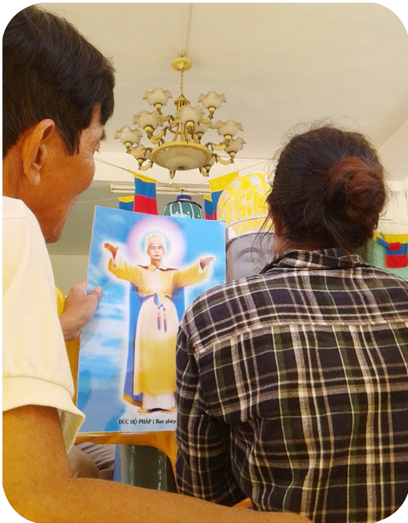
Thợ hồ đang xem lại di ảnh của Đức Hộ Pháp để đắp vá lại cho đúng