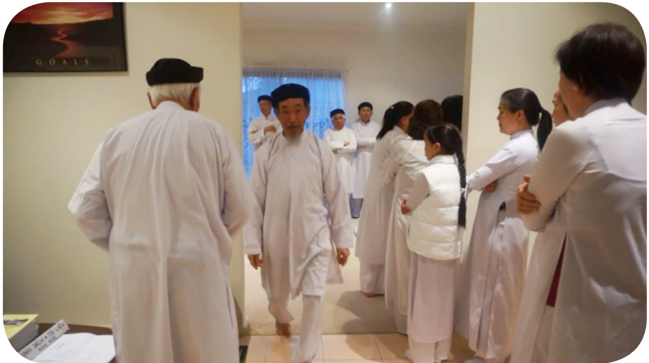
Chuẩn bị nhập Đàn