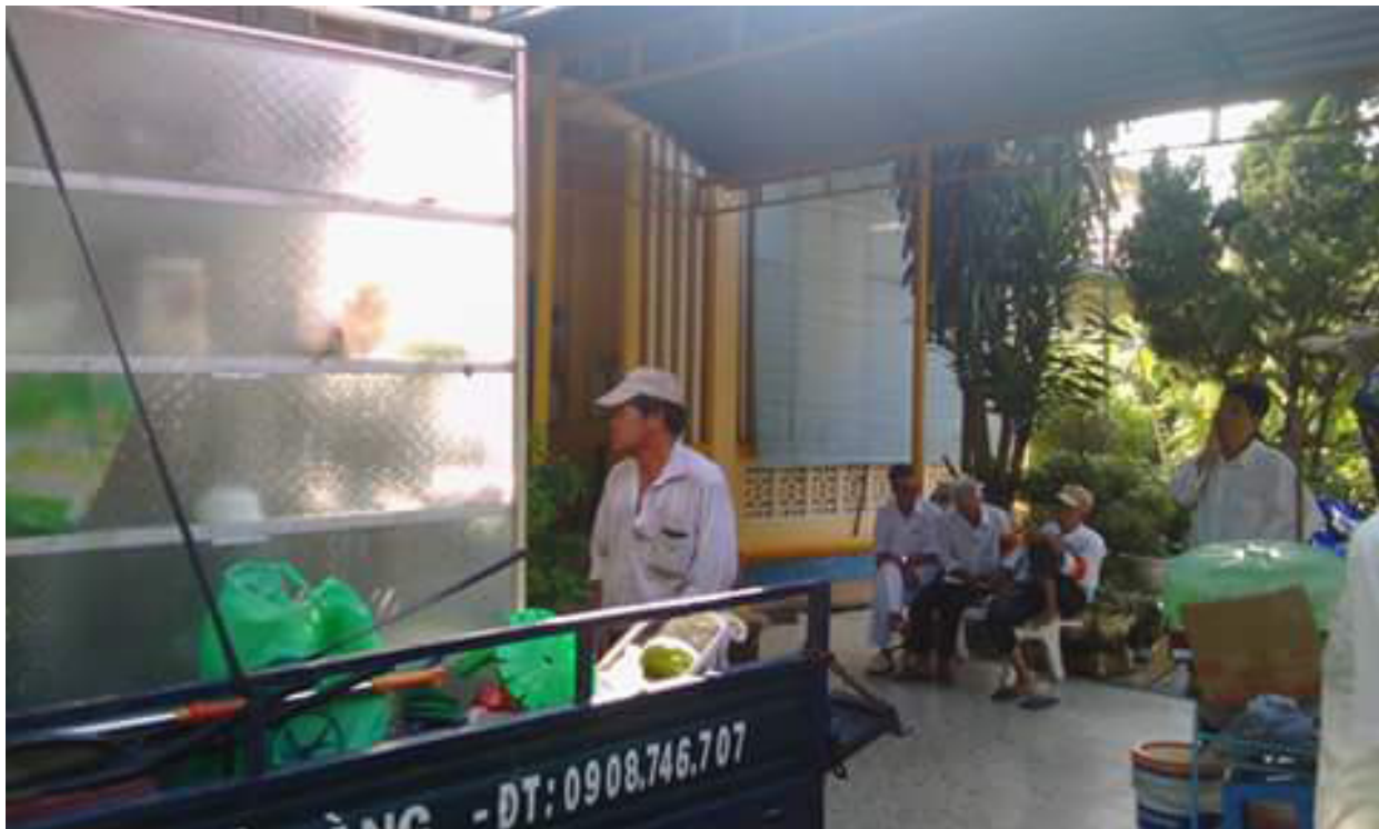
Bị Quỷ vương khảo đảo...