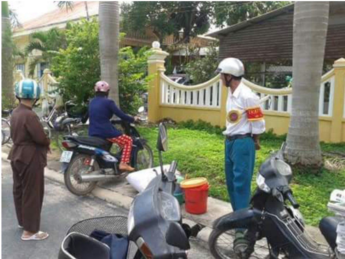
Trật tự canh giữ bên ngoài hàng rào Văn phòng HTD