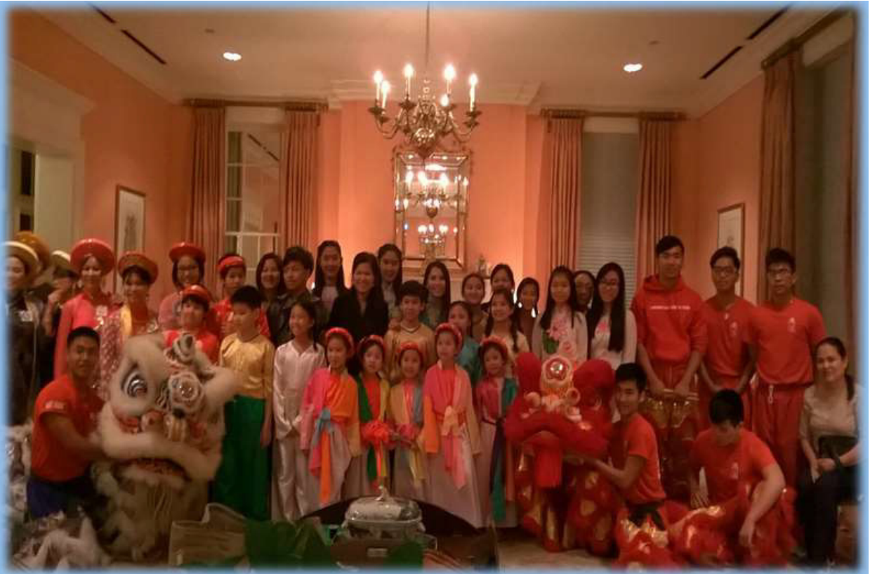
Đoàn Ca Múa và Đoàn Lân La Vàng tại phòng chờ của UNA-Houston Day