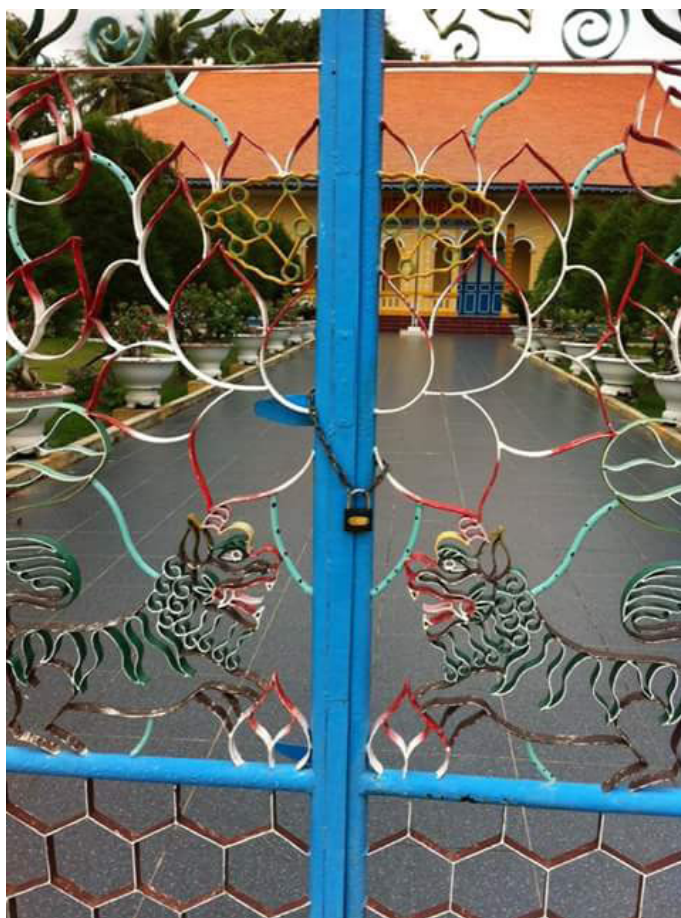
Cổng Văn phòng Hiệp Thiên Đài đã bị khóa

Sau đây là một số hình ảnh ghi nhận được: