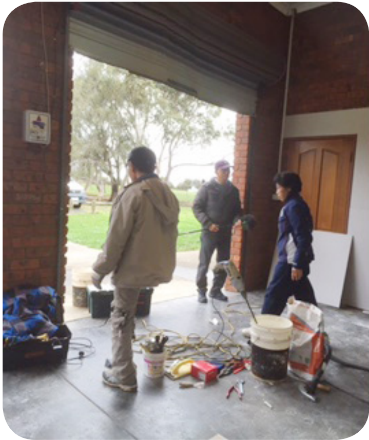
sửa chữa nơi thờ phượng tạm