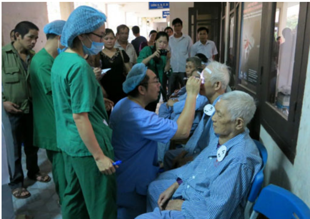
Bác sĩ Tadashi Hattori khám chỉ định trước khi phẫu thuật.

Nắng nóng hay thời tiết giá lạnh, bất kỳ biến động thiên nhiên bất thường nào cũng không thể ngăn được nỗ lực của bác sĩ Tadashi Hattori người Nhật trong việc đi lại và phẫu thuật cho các bệnh nhân có vấn đề về mắt tại Việt Nam.