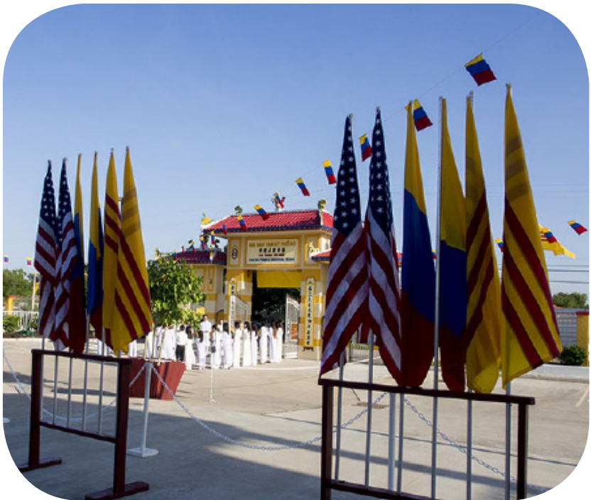
Cổng vào với hàng cờ Việt Mỹ và cờ Cao Đài