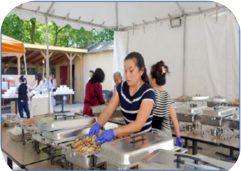
Những anh hùng 'bò đười' trong nhà bếp