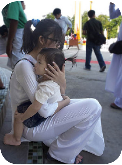
Khi cha mẹ bận làm lễ chị lớn lo chăm sóc các em nhỏ.