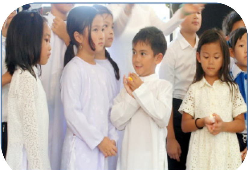
Hàng tỉ ben giúp chèn khóa, giúp chào cờ, và chờ 2 hrs để tham gia giúp phát cộng lương "W"