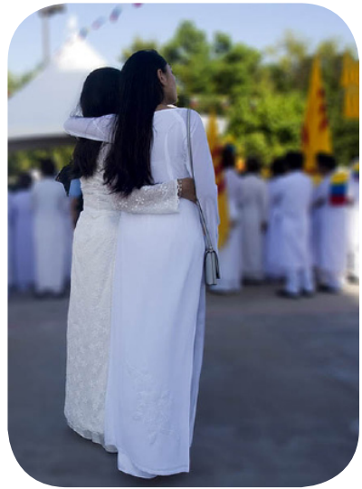
Hai tín nữ thân mật hàn huyên