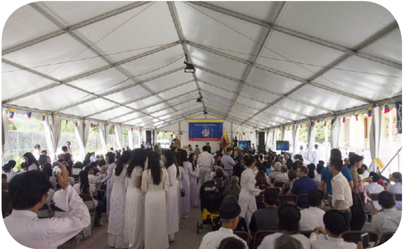
Buổi Lễ và Diễn Văn trong Hội Trường