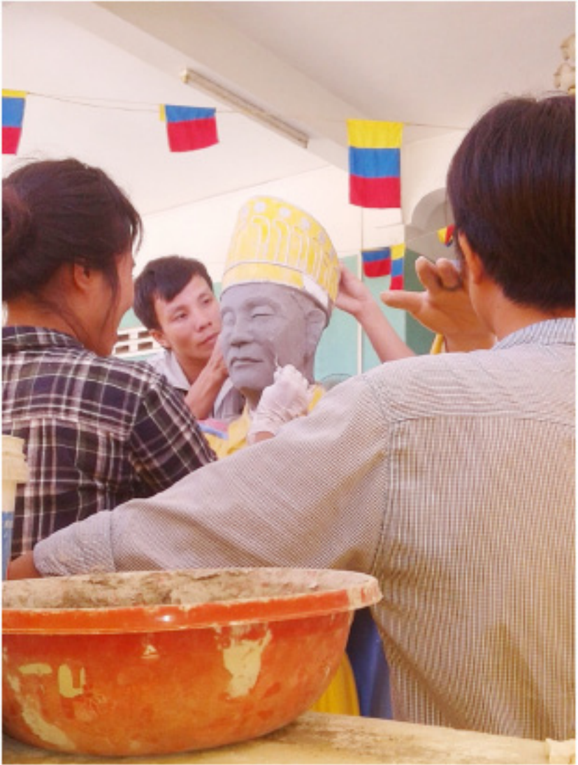
Thợ hồ đang khấn trang đắp vá lại tượng Đức Hộ Pháp