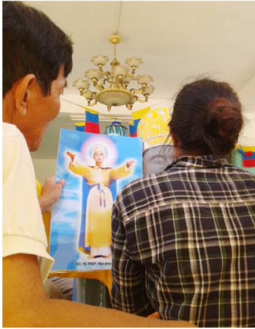
Thợ hồ đang xem lại di ảnh của Đức Hộ Pháp để đắp vá lại cho đúng