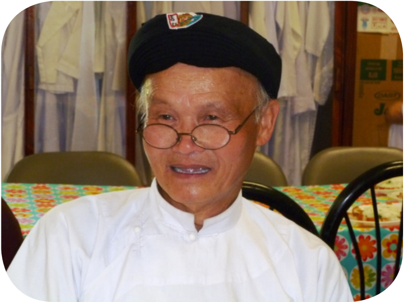
CTS Lê Tấn Tài, Qu. Đầu Tộc