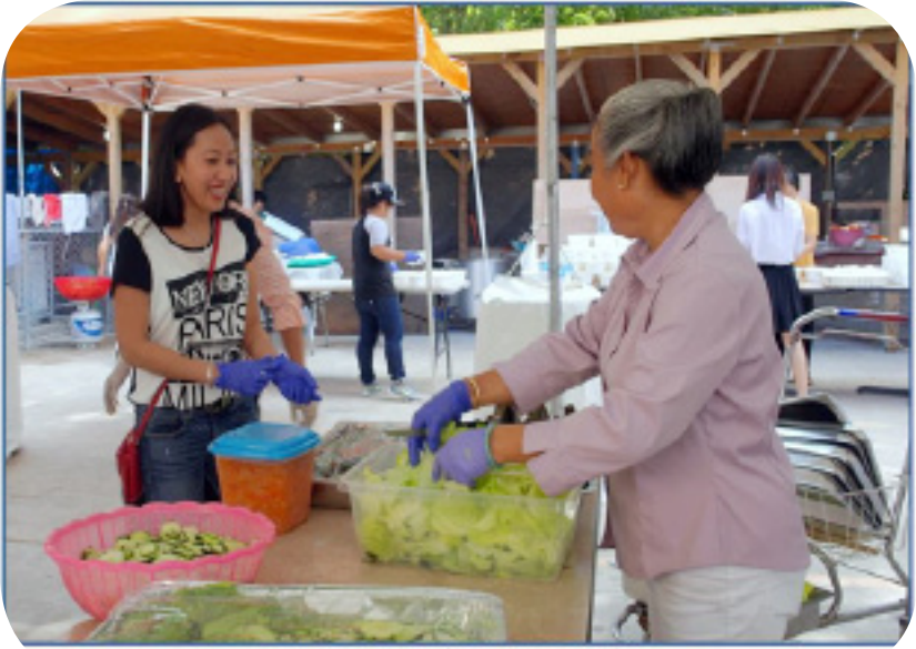
Những anh hùng 'bò đười' trong nhà bếp