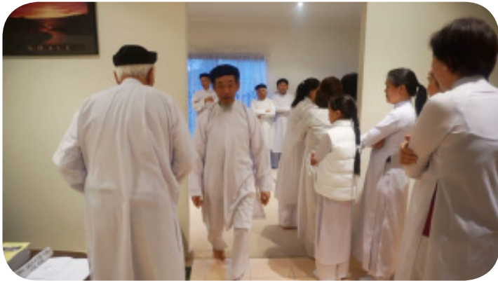
Chuẩn bị nhập Đàn