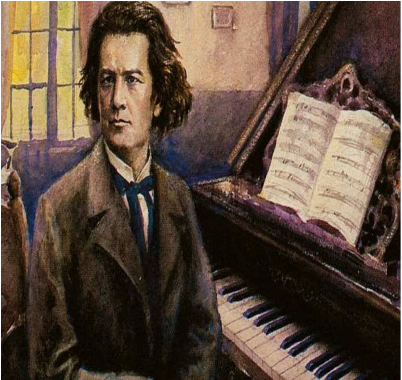
Mỗi an bài của Đấng Tạo Hóa đều là có lý do – Tranh vẽ Ludwig van Beethoven

nó. Nếu bạn hiểu được một điểm này, bạn sẽ có cơ hội dựa vào chuyển biến tâm thái mà siêu việt ảnh hưởng tiêu cực của những sự tình ấy, trí tuệ của bạn chính là từ đây mà được nâng cao.