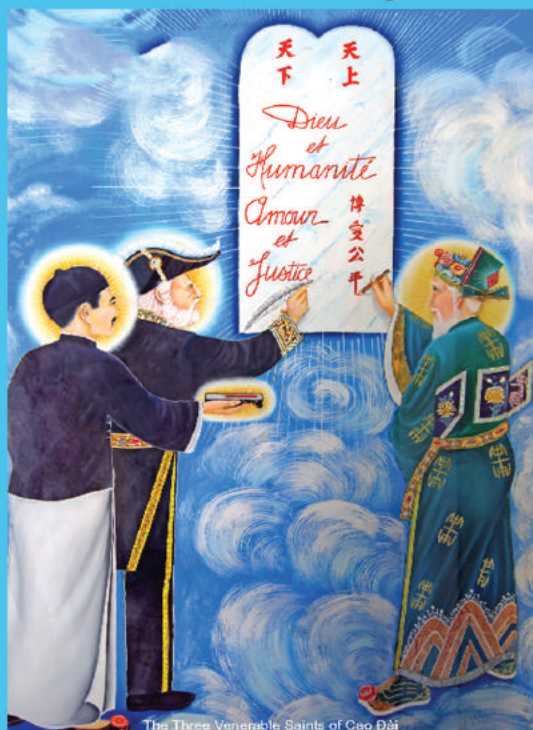
The Three Venerable Saints of Cao Đài