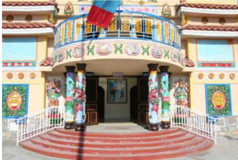
Mặt tiền Thánh Thất Oranwood 21-12-2008