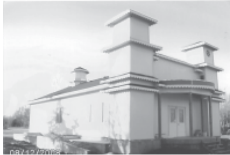
Thánh Thất Wichita, Kansas ( hình chụp ngày 08-12-2008)