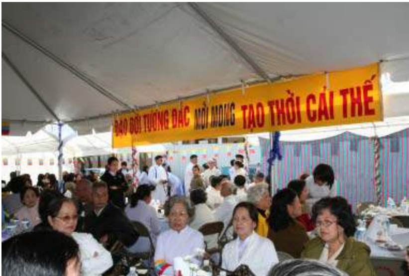
Đồng đạo tham gia bữa cơm gây quỹ