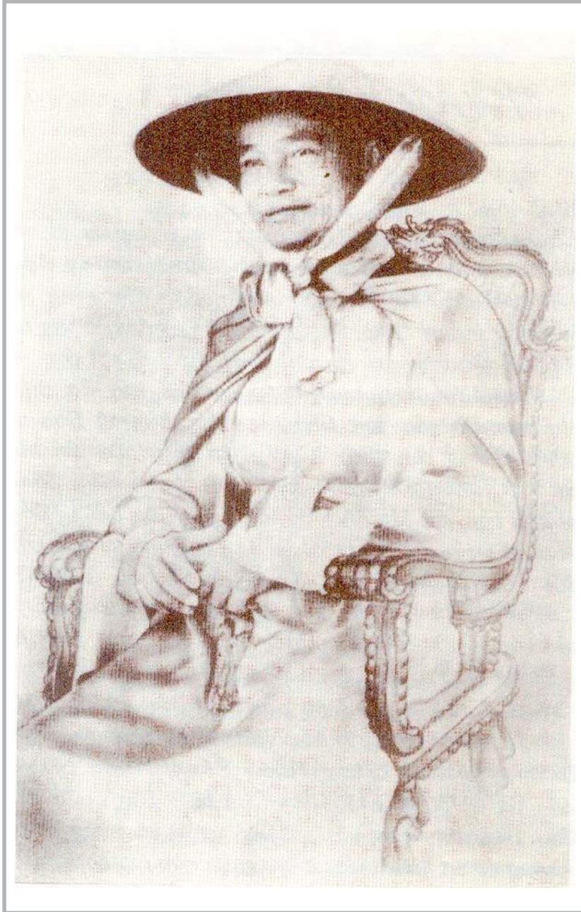
Đức Hộ Pháp Phạm Công Tắc