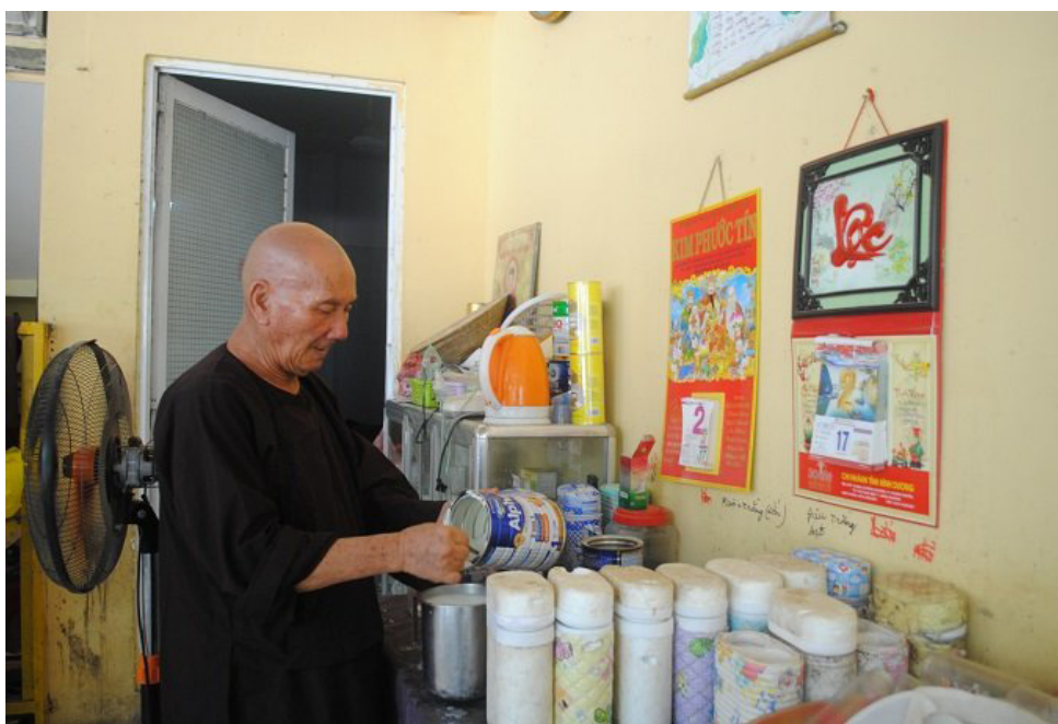
Ông Sứ đang pha sữa cho các cháu.