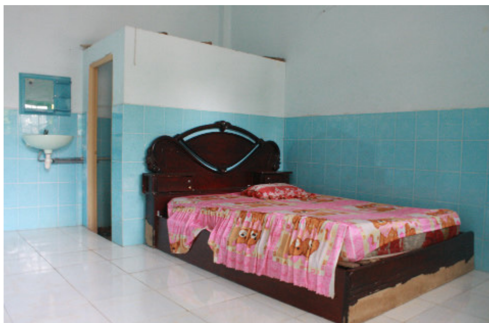
Một căn phòng trong khách sạn Ngọc Quý