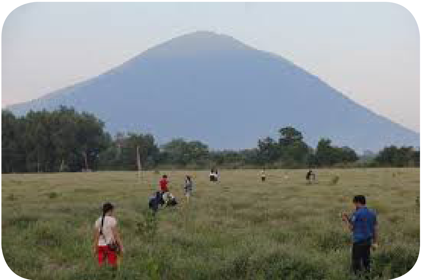
Núi Bà Tây Ninh