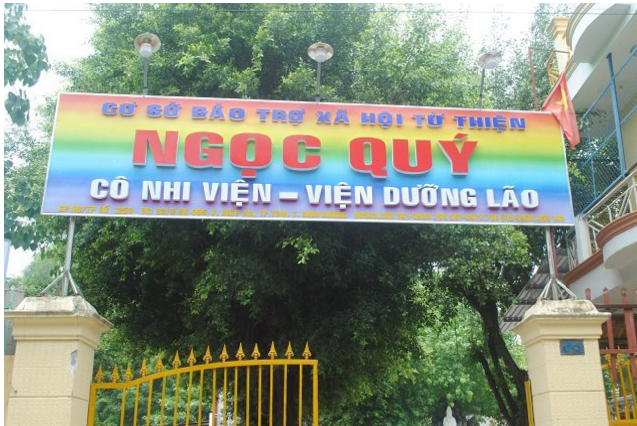
“Khách sạn” của tình thương