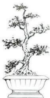
Cây Thất Thánh hay Thất Hiền

Cây uốn như cây Thất Thánh nhưng có 8 tầng biểu tượng cho Bát Tiên (Lữ Đồng Tân cỡi chim hạc, cầm bửu pháp Gươm và Phất Chủ , Hà Tiên cô, cỡi chim phụng với bửu pháp Hoa Sen, Hàn Tương Tử, thổi sáo cỡi chim công với bửu pháp giỏ Hoa Lam, Lam Thế Hòa, cỡi chim trĩ, với bửu pháp Cặp Ngọc Bản (Cặp Sanh ngọc), Tào Quốc Cự, cỡi nai (Mai Hoa Lộc) với bửu pháp Thủ Quyển bằng ngọc , Lý Thiết Quả, cỡi voi với bửu pháp bầu Hồ Lô, Gậy Sắt, Hớn Chung Ly, cỡi tứ bất tướng với bửu pháp Quạt Long Tu và Phất Chủ , Trương Quả Lão, cỡi lừa ngược cầm bửu pháp Cây Gậy )