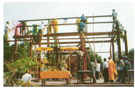
Lễ gác đòn dông (thượng lương)