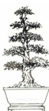
Cây vũ trụ