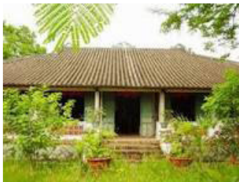
Nhà chữ nhất 一

Nhà chữ nhất 一 tức là một căn nhà ba gian hai chái đứng một mình không có nhà phụ;