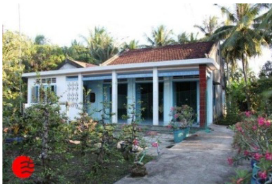
Nhà chữ Đinh 丁

của hai nhà thẳng góc với nhau tạo thành hình dạng chữ đinh hay hình dạng chữ T. Có khi nhà dưới cách nhà trên một thảo bạt hay mái ngang. Đôi khi nhà có gian thảo bạt xây ngay phía sát trước mặt nhà trên, nhằm tạo thêm một gian để tiếp khách. Ngoài ra, một biến thể khác là nhà chữ đinh có nhà cầu nối, tức là nhà trên và nhà dưới nối với nhau qua một gian trung gian là gian nhà cầu, trải dài suốt chiều dài nhà dưới và chiều sâu nhà trên nhằm để tránh khách lạ đi trực tiếp vào nhà trên, nơi thờ cúng của gia đình.