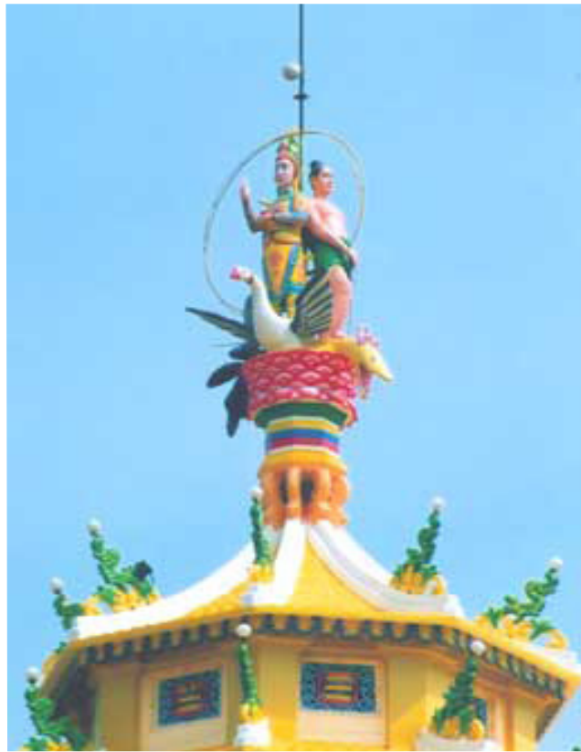
Tượng Tam Thế Phật nơi Bát Quái Đài Đền Thánh

Đức Chí Tôn dạy lúc khai Đạo “Khai Thiên Địa vốn Thầy, sanh Tiên Phật cũng Thầy, Thầy đã nói một chơn thân Thầy mà biến ra Càn Khôn Thế Giới và cả nhân loại. Thầy là chư Phật , chư Phật là Thầy ... Thầy khai Bát Quái mà tác thành Càn Khôn Thế Giới mới gọi là Pháp ; Pháp có mới sinh ra càn khôn vạn vật, rồi mới có người, nên gọi là Tăng .... Thầy là Phật chủ cả Pháp và Tăng .” “Chi chi hữu sanh cũng do bởi Chơn Linh Thầy mà ra. Thầy là Cha của sự sống....”.