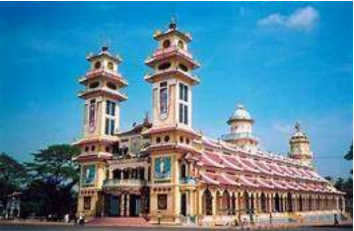
Bát Quái Đài Đền Thánh Tây Ninh (xa bên phải)

Trong Đạo Cao Đài, Tam Thế Phật được tạc tượng trên nóc Bát Quái Đài Đền Thánh: