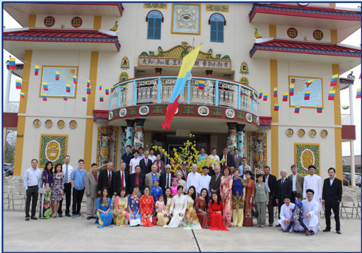
Houston Ngày 20 Tháng 2 Năm 2018 - Mừng 5 Tết