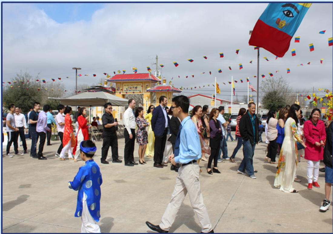
Hái lộc đầu Xuân - là một truyền thống để mang lại hạnh phúc cho gia đình.