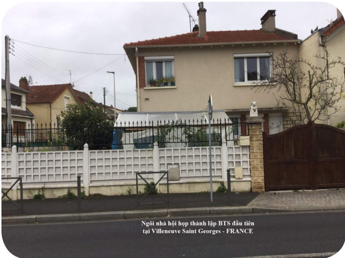
Ngôi nhà hội họp thành lập BTS đầu tiên tại Villeneuve Saint Georges - FRANCE

- Tháng 10 năm 2004, sau một năm hoạt động đồng Đạo quyết định mua một miếng đất khu gia cư rộng 500m 2 có ngôi nhà và sửa sang làm nơi thờ phượng.