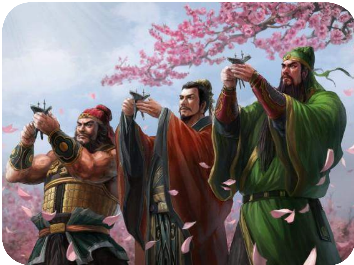
Quan Vũ, Lưu Bị và Trương Phi. Kết nghĩa vườn đào, thề cùng sinh tử.

Đó là tình bạn giống như mối quan hệ giữa Quan Vũ và Lưu Bị. Kết nghĩa vườn đào, thề cùng sinh tử, Quan Vũ là em, là trợ thủ đồng thời cũng là tri kỷ của Lưu Bị. Ở dưới trướng Tào Tháo, dù hưởng vinh hoa phú quý, bạc vàng mỹ nữ, được ân phong hầu nhưng Quan Vũ trước sau vẫn một lòng hướng về Lưu Bị khi ấy cũng đang phiêu dạt bốn bề, tay trắng dựng nghiệp. Sau, nghe tin Lưu Bị đang ở chỗ Viên Thiệu, Quan Vũ cưỡi Xích Thố không quản ngày đêm vượt nghìn dặm tìm về.