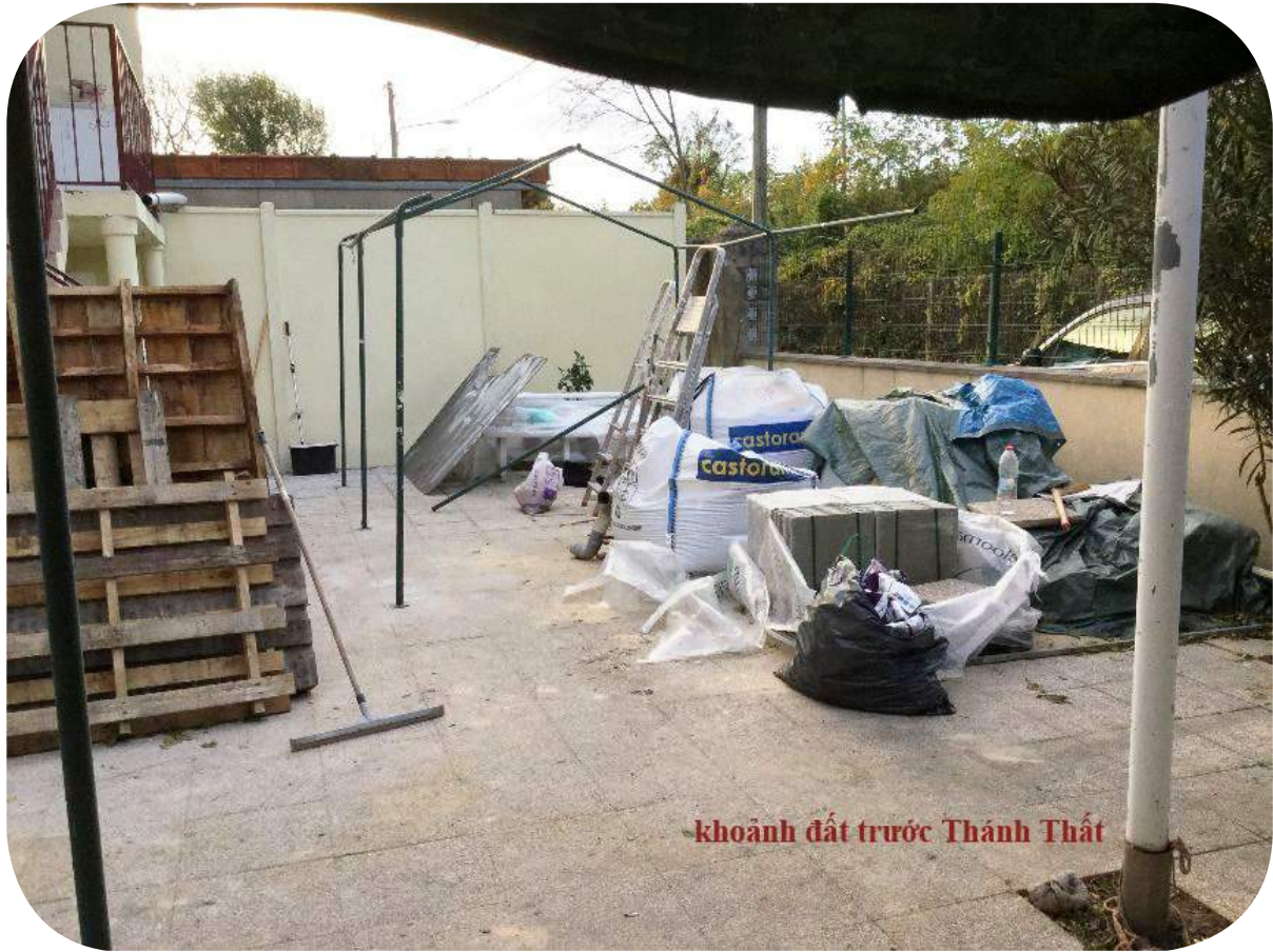
khánh đất trước Thành Thất