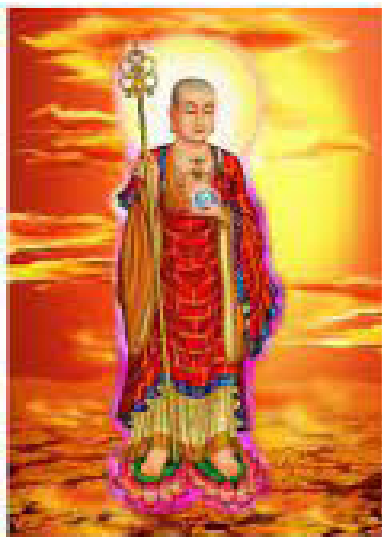
Bồ Tát Địa Tạng Vương