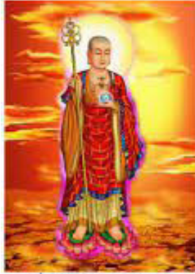
Bồ Tát Địa Tạng Vương