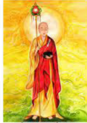
Bồ Tát Mục Kiền Liên