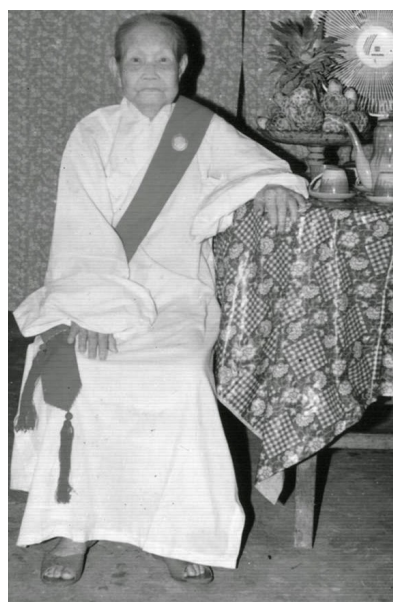
Hình người Mẹ lúc 81 tuổi

Đám ma mẹ tôi được tổ chức theo lễ nghi tôn giáo Cao Đài. Theo luật của Đạo, người tín đồ Cao Đài Giáo, nếu khi còn sinh thời ăn chay đủ 10 ngày trong tháng khi qui liễu được thọ truyền bửu pháp, tức là các phép bí tích độ hồn trong cơ tận độ của Chí Tôn, nếu ăn chay 6 ngày trong một tháng thì không hưởng được những điều này và tang lễ chỉ làm bật tiến mà thôi (Làm bật tiến là làm lễ dâng lên các đấng Thiêng liêng xin cứu giúp vong hồn cho được siêu thăng) . Mẹ tôi vì không