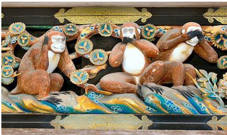
Hình điêu khắc ba con khỉ do Hidari Jingoro tạc trên vách đền Toshogu ở Nikko, Nhật

Thực ra, nguồn gốc xuất xứ của bức tượng này bắt nguồn từ Ấn Độ vài ngàn năm về trước. Lúc đầu, đó là bức tượng về một vị thần, là thần Vajrakilaya. Đây là vị thần có sáu tay, mỗi đôi tay dùng để bịt hai mắt, hai tai và miệng. Theo đó bức tượng được khắc nhằm để răn dạy mỗi người: không được nói bậy, không nhìn bậy và không nghe bậy.