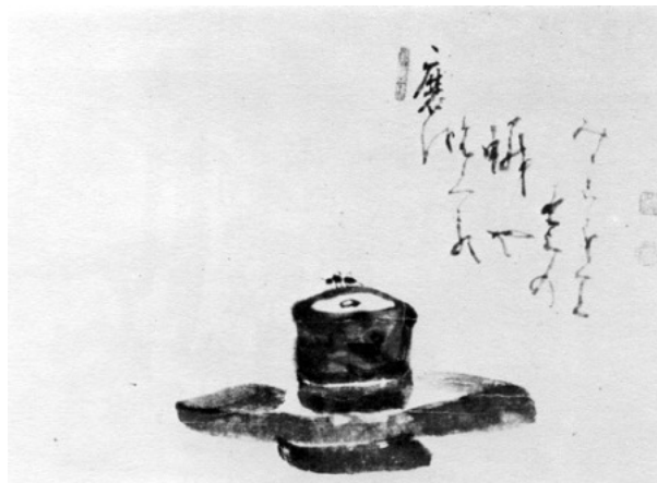
Cối Xay và Kiến - tranh của thiền sư Hakuin

The Zen master Hakuin was praised by his neighbors as one living a pure life.