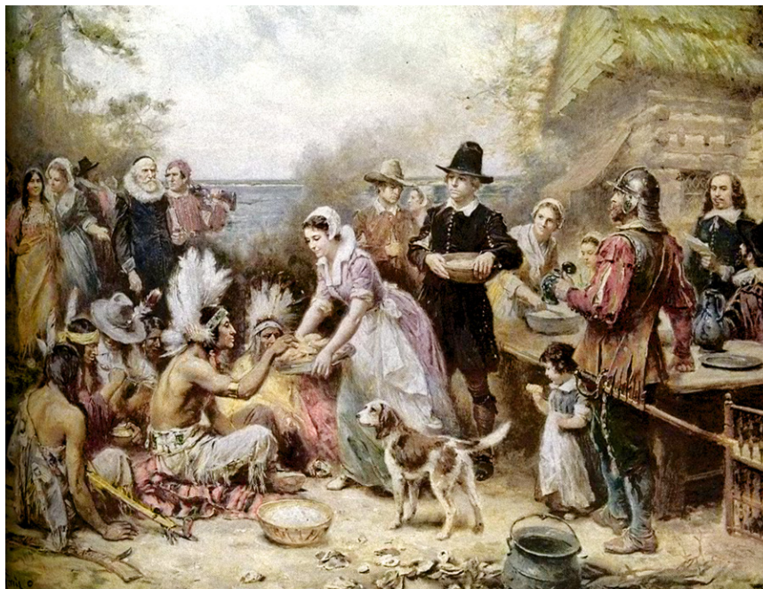
Bức tranh The First Thanksgiving của Jean Leon Gerome Ferris , người da trắng mời người da đỏ cùng ăn