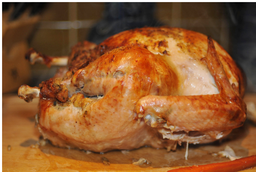
Gà tây nướng lò, một món ăn thường thấy trong ngày Lễ Tạ ơn

Lễ Tạ ơn thường được tổ chức với một buổi tiệc buổi tối cùng với gia đình và bạn bè với món thịt gà tây . Tại Canada và Hoa Kỳ, nó là một ngày quan trọng để gia đình sum họp với nhau, và người ta thường đi xa để về với gia đình. Người ta thường được nghỉ bốn ngày cuối tuần cho ngày lễ này