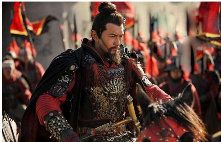
Tạo hình Nhạc Phi trên phim.

Trong lịch sử, những điển tích quên mình vì nghĩa nhiều vô số. Như Tô Vũ 19 năm khổ ải chặn dê, Trương Tuần tận vong báo quốc, sự trung thành của Phụ tử Nhạc Phi... tất cả đã viết nên một thiên sử: “ Nhân sinh tự cổ thù vô tử? Lưu thủ đan tâm chiếu hãn thanh ” (Sống ở trên đời từ cổ chí kim, hỏi có ai không chết? Nguyên giữ lòng son này chiếu rọi sử xanh). Tả Quang Đầu, Đàm Tự Đồng... những danh nhân này chỉ cần buông bỏ đức tin đạo nghĩa trong lòng mình thì đều được hưởng vinh hoa phú quý, nhưng họ đều không tham sống sợ chết.