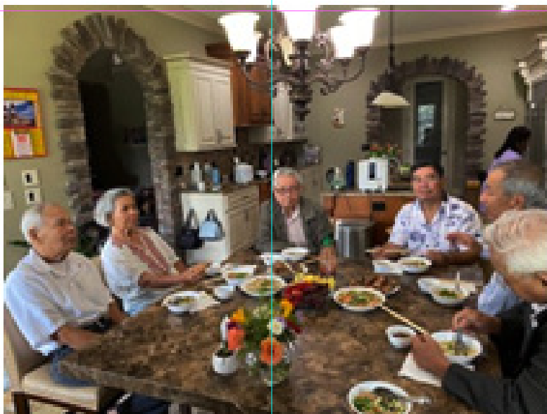
Dùng cơm thân mật với anh Chị HT Hưng