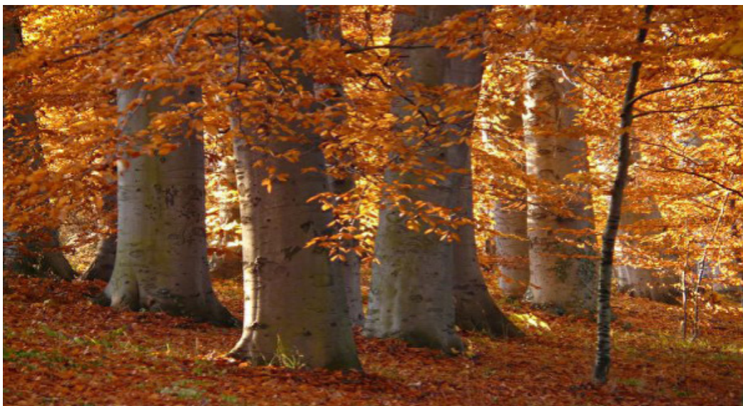
Vào mùa thu, thiên nhiên vẫn tràn ngập sự hài hòa.

Khí hậu lúc ấy sẽ là, khí nóng giảm xuống, hàn khí nhiều lên, chênh lệch nhiệt độ giữa ngày và đêm lớn dần. Vì thế người xưa mới có câu “Bạch lộ thu phân dạ, nhất dạ lãnh nhất dạ”. Tức là ban đêm trong tiết Bạch lộ và Thu phân, mỗi đêm một lạnh. Thời tiết ban đêm se lạnh, không nên xem nhẹ.