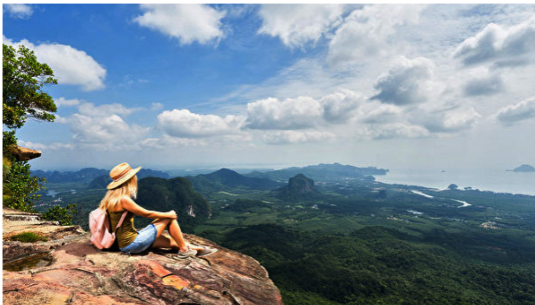
Thưởng ngoạn phong cảnh từ trên cao, ngắm nhìn mùa thu vàng, xua tan ưu phiền.

qua cách ăn uống để bổ âm nhuận phế. Các món cháo, canh có tính ôn nhuận là rất thích hợp để bồi bổ cho cơ thể vào mùa thu. Những thực phẩm màu trắng cũng rất tốt cho nhuận phế, dưỡng âm, trừ khô. Nên tránh những thực phẩm kho và đồ chiên cay nóng để tránh tăng chỉ số khô da, khô phế.