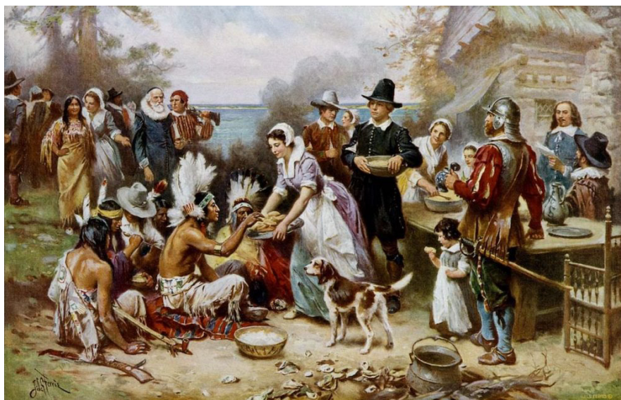
Bức tranh The First Thanksgiving của Jean Leon Gerome Ferris, người da trắng mời người da đỏ cùng ăn

Năm sau, vào Mùa Thu, 1621, mùa màng thu hoạch tốt, Thống đốc William Bradford tuyên bố một ngày tạ ơn. Khoảng 50 di dân tổ chức Harvest Festival (Hội Mùa Gặt) đầu tiên kéo dài ba ngày và họ mời khoảng 90 thổ dân Wampanoag tới cùng chung vui và bày tỏ lòng biết ơn.