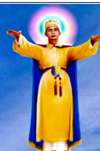
Đức Hộ Pháp Ban Phép Lành