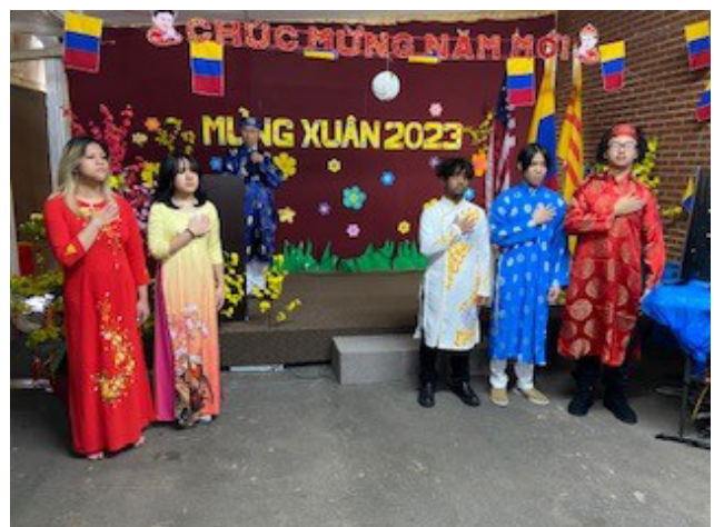
Thiếu nhi hát bài Quốc ca Hoa Kỳ