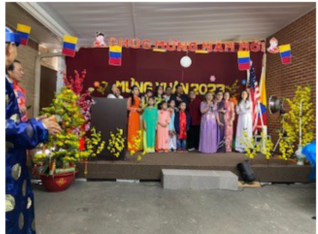
Tiết mục đồng ca