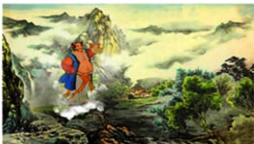
Hình Hớn Chung Ly