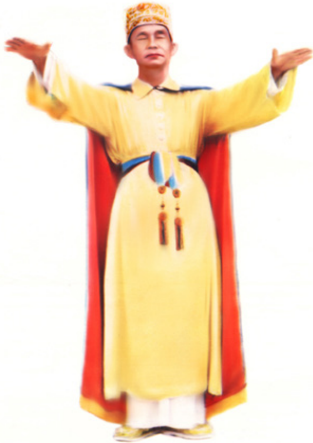
Đức Hộ Pháp Ban Phép Lãnh

Chữ tu tiếng Phạn gọi là Dyana, người Miên tức nhiên người Tản Nhon nói trại lại một chút Xaxona. Tiếng Pháp hay tiếng bên Âu Châu Se perfectioner nghĩa là Rendre parfait ou plus parfait có nghĩa là làm thế nào cho mình đặng tận thiện tận mỹ. Tiếng tu nó bao quát như thế, thiên kinh vạn điển tiếng của các Tôn Giáo