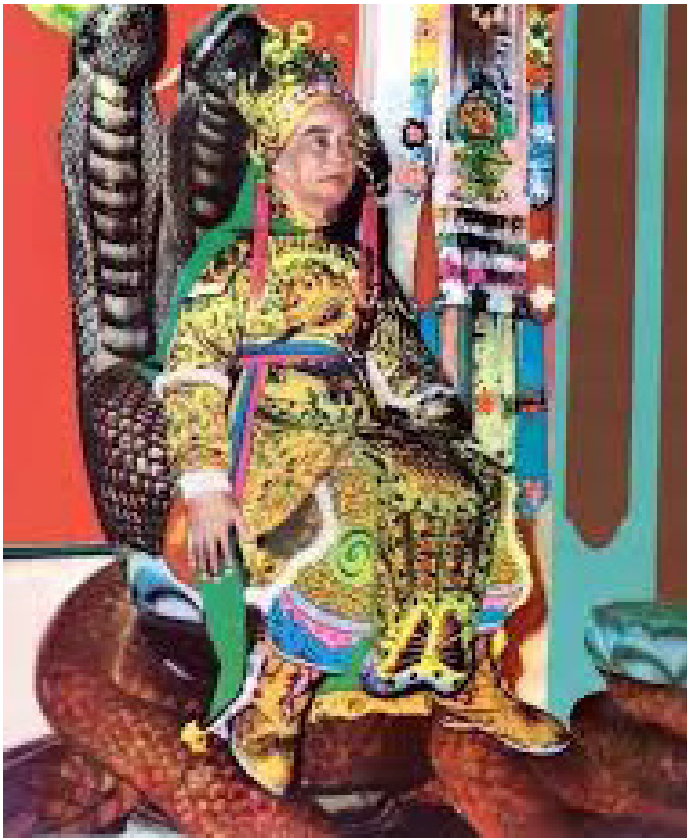
Đức Hộ Pháp Phạm Công Tắc

* 11 giờ 30 đêm 14 rạng 15 tháng 3 năm Bính Dần (đêm 25 rạng 26- 4- 1926 ) Đức Ngài được Đức Chí Tôn trực hồn khởi xác để chơn linh Hộ Pháp ngự vào. Trong Đạo Cao Đài chỉ có Đức Ngài là môn đệ duy nhất được hưởng đặc ân này. Sứ mạng thiêng liêng của Đức Hộ Pháp được mô tả trong mấy câu kinh :