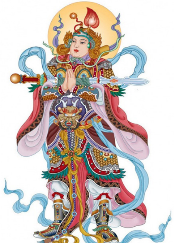
Vi Hộ Pháp

*Ngày 15-8-Bính Thân (dl 19-9-1956), tại Báo Ân đường Kim Biên, Đức Thanh Sơn Đạo Sĩ (Trạng Trình Nguyễn Bình Khiêm, Động chủ Bạch Vân Động nơi cõi thiêng liêng) giảng cơ, phò loan: Đức Phạm Hộ