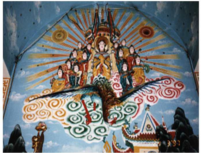
Đức Phật Mẫu & Cửu Vị Tiên Nương