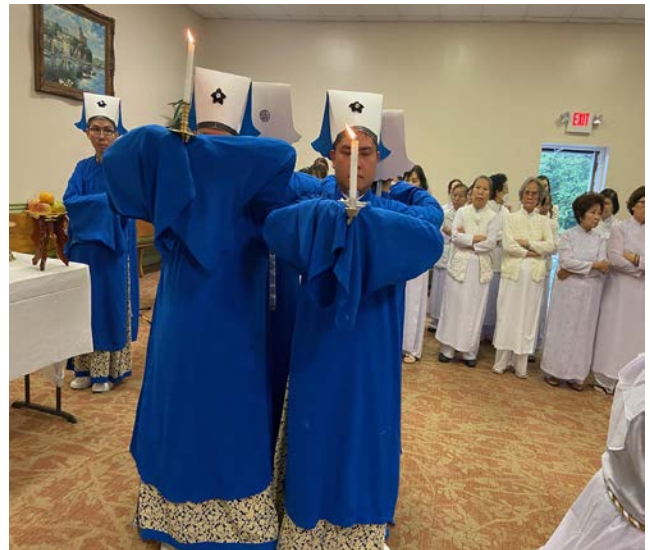
Nghi lễ theo Cao Đài Giáo Quang cảnh Lễ sĩ đang dâng rượu, trà ...

hưởng hồng ân của Đức Đại Từ Phụ, Đức Đại Từ Mẫu và các Đấng ban cho.