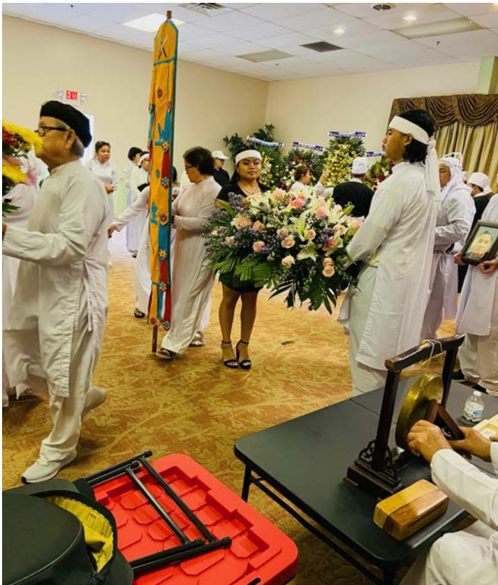
Quang cảnh chuẩn bị di quan