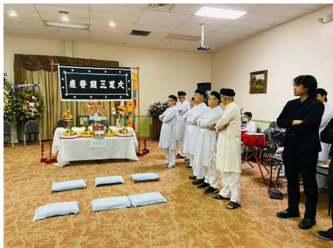
Quang cảnh gia đình tế lễ người thân qui liễu

Bàn Trị Sự và Đồng đạo Thánh Thất Atlanta GA rất xúc động và thương tiếc trước sự ra đi quá bất ngờ này.