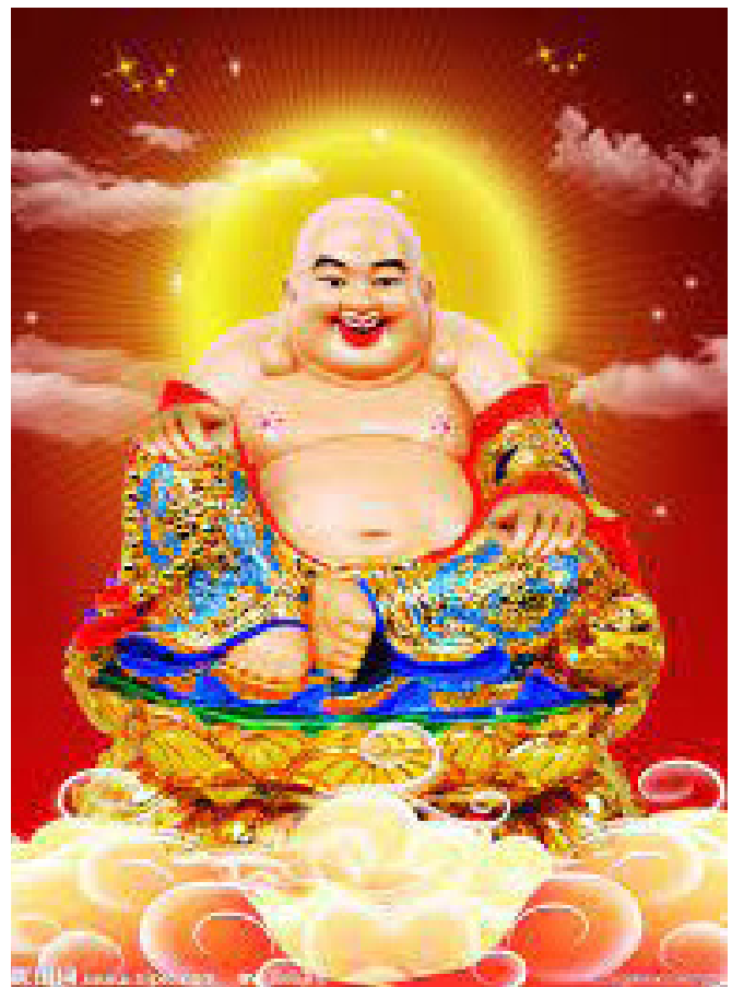
Đức Phật Di Lạc Vương