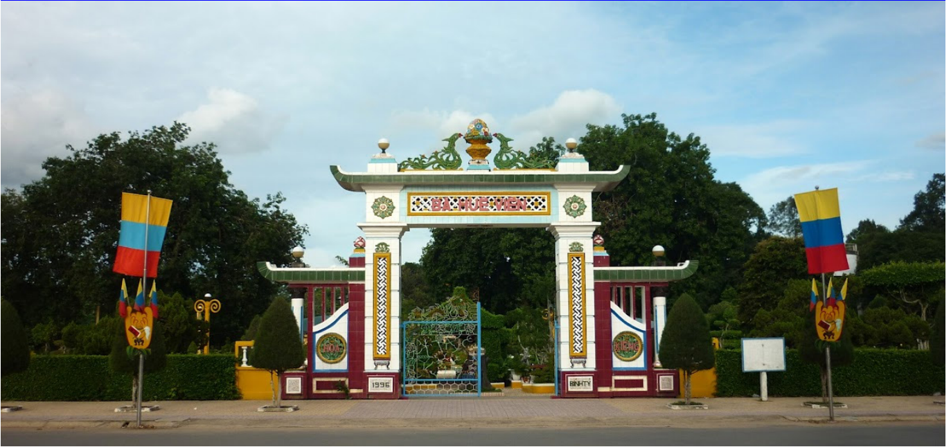
Bá Huê Viên - Nội Ô Tòa Thánh