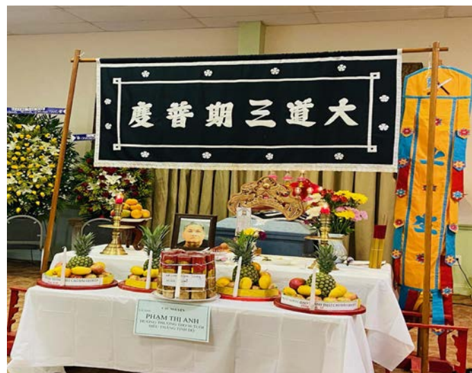
Các mâm tế trên bàn vong