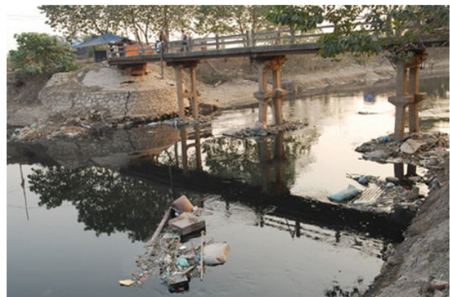
The pollution has mostly been caused by untreated wastewater discharged by households, industrial zones, hospitals, and craft village.