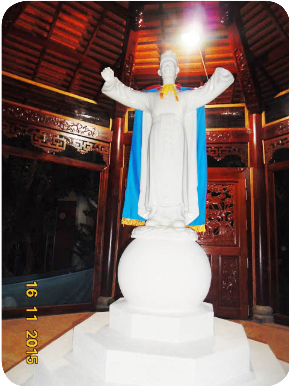
Tượng Đức Hộ Pháp tại Thánh Thất Kim Biên, Campuchia