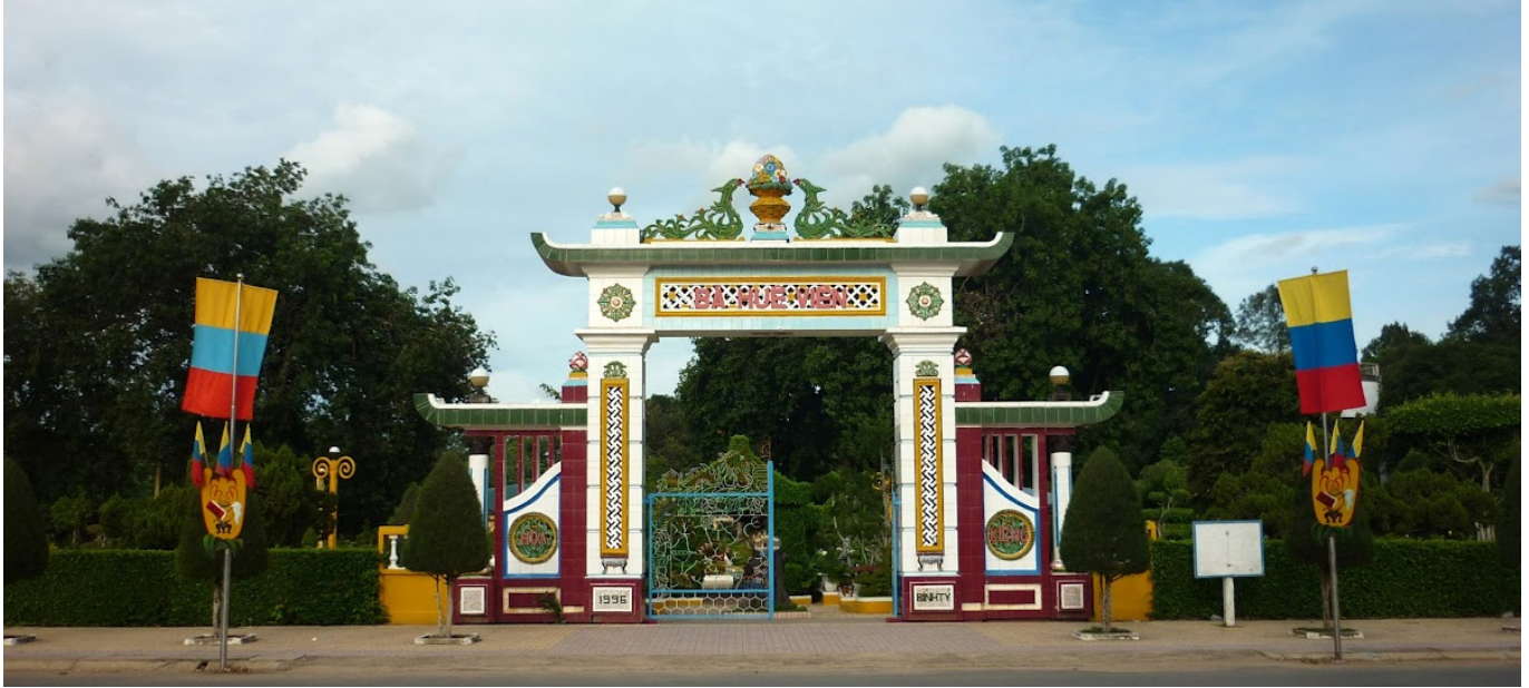
Bá Huê Viên - Nội Ô Tòa Thánh