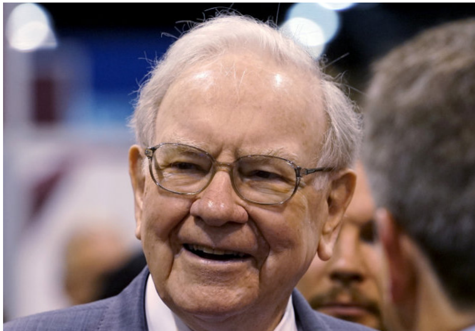
Tỷ phú Warren Buffett

TTO - Tỷ phú Mỹ Warren Buffett có chừng 70 tỷ USD và tuyên bố sẽ cho đi chứ không giữ lại cho mình. Trong 10 năm qua, ông đã hiến tặng đến hơn 27,5 tỉ USD.