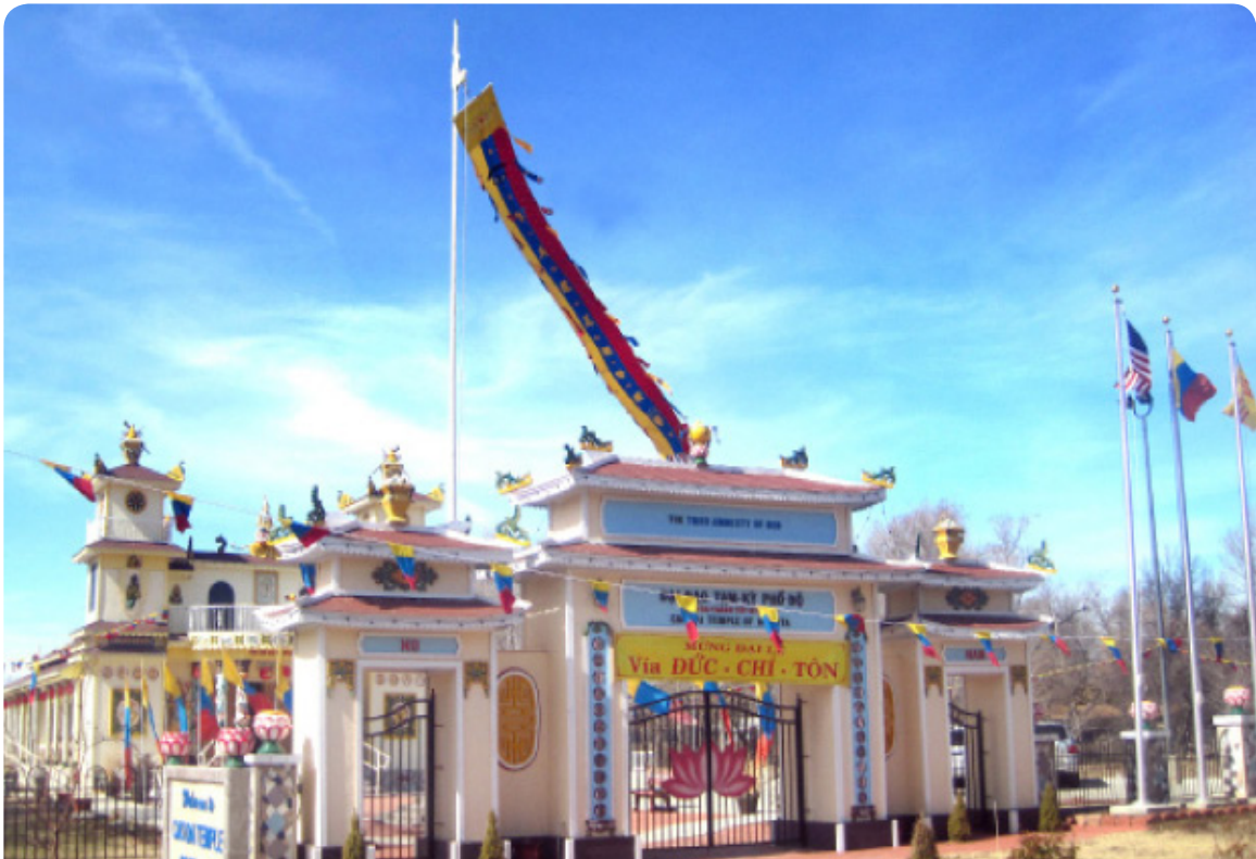
Thánh Thất Wichita Kansas